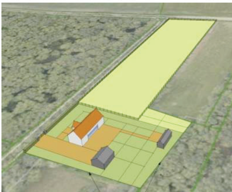
Figuur 1 Inrichtingsschetsen. Een woning van circa 155 m 2 , een bijgebouw van 48 m 2 en een bijgebouw van 27 m 2