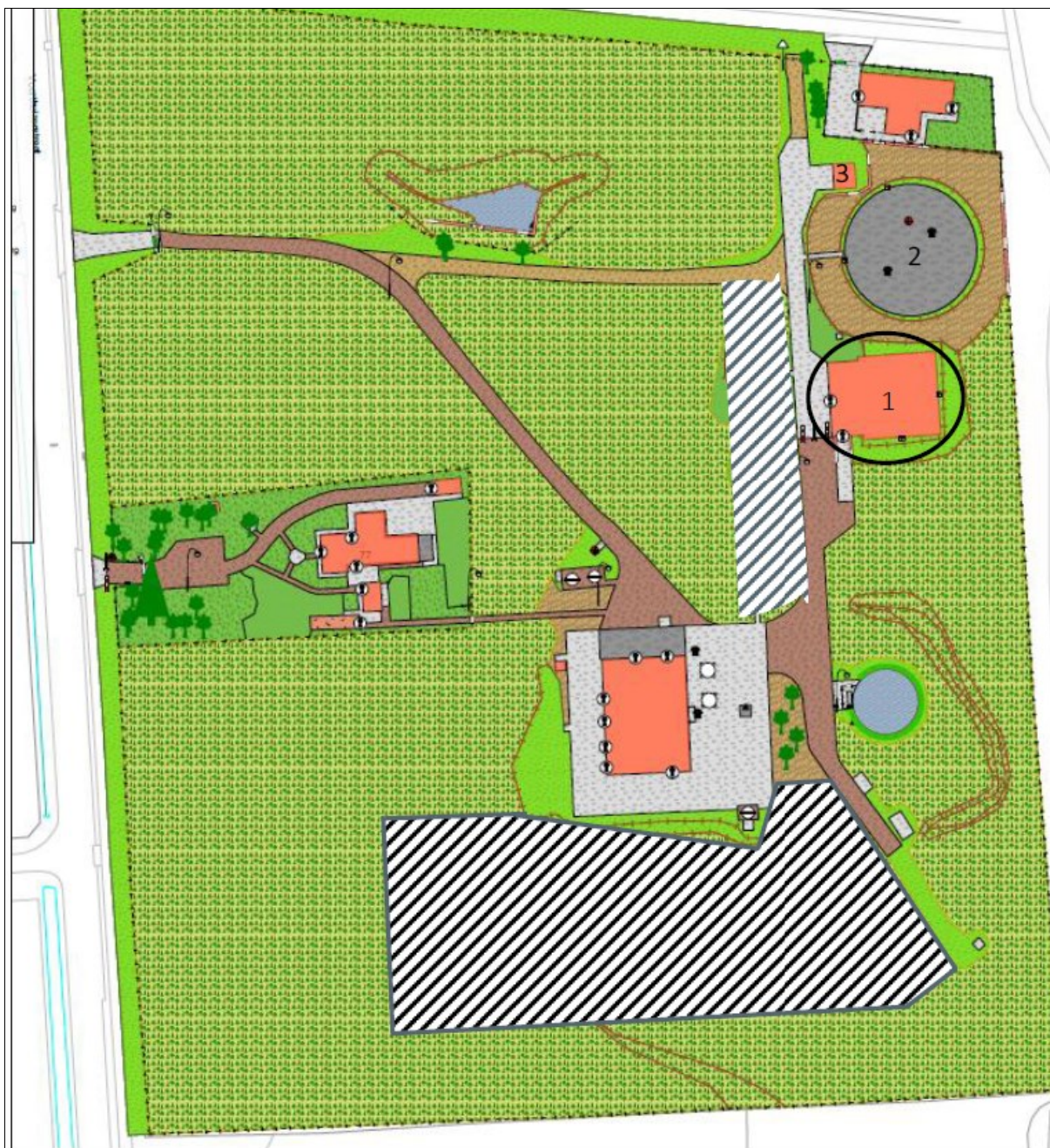
Figuur 2: Ligging van de reinwaterkelder (1), de slibvijver (2) en het schuurtje (3), die gesloopt gaan worden en de ligging van het te kappen bos aan de zuidzijde van het terrein (gearceerde deel). Voorts wordt een strook bos gekapt ten westen van de slooplocatie (ook gearceerd).