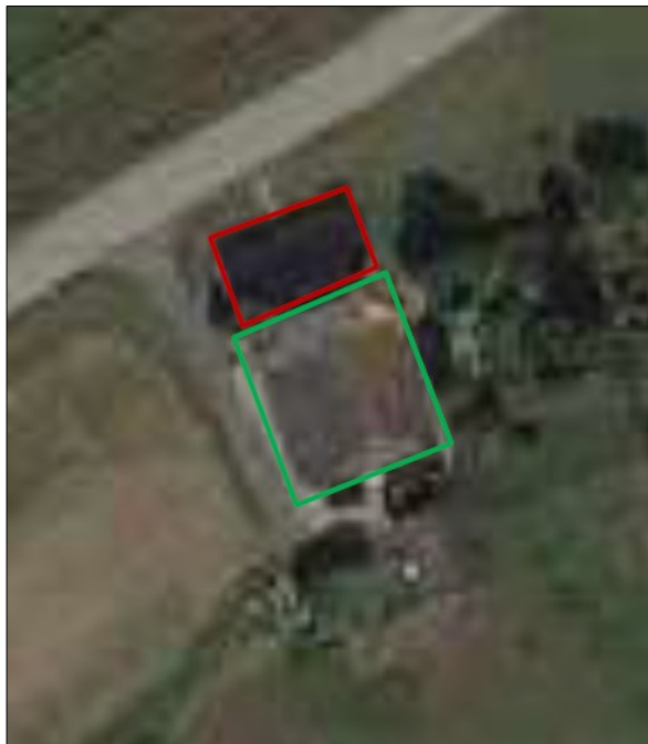
Figuur 2. Begrenzing van de woning waar de werkzaamheden worden uitgevoerd (rood kader) en het deel waar geen werkzaamheden worden uitgevoerd (groen kader).