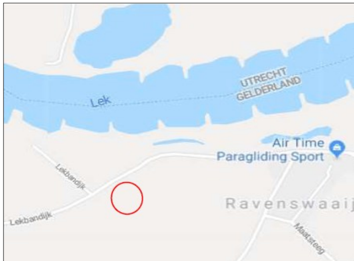
Figuur 1. Ligging plangebied