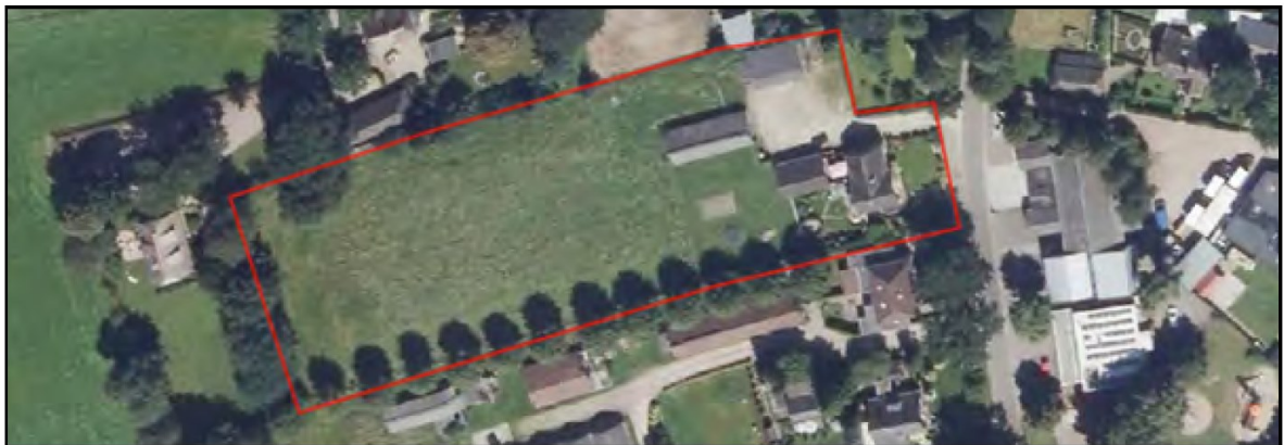
Figuur 2 Huidige situatie van het projectgebied (rood omkaderd).