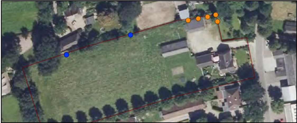
Figuur 3 Locaties van de tijdelijke mitigatie voor de Huismus (oranje stip) en de Gewone dwergvleermuis (blauwe stip).