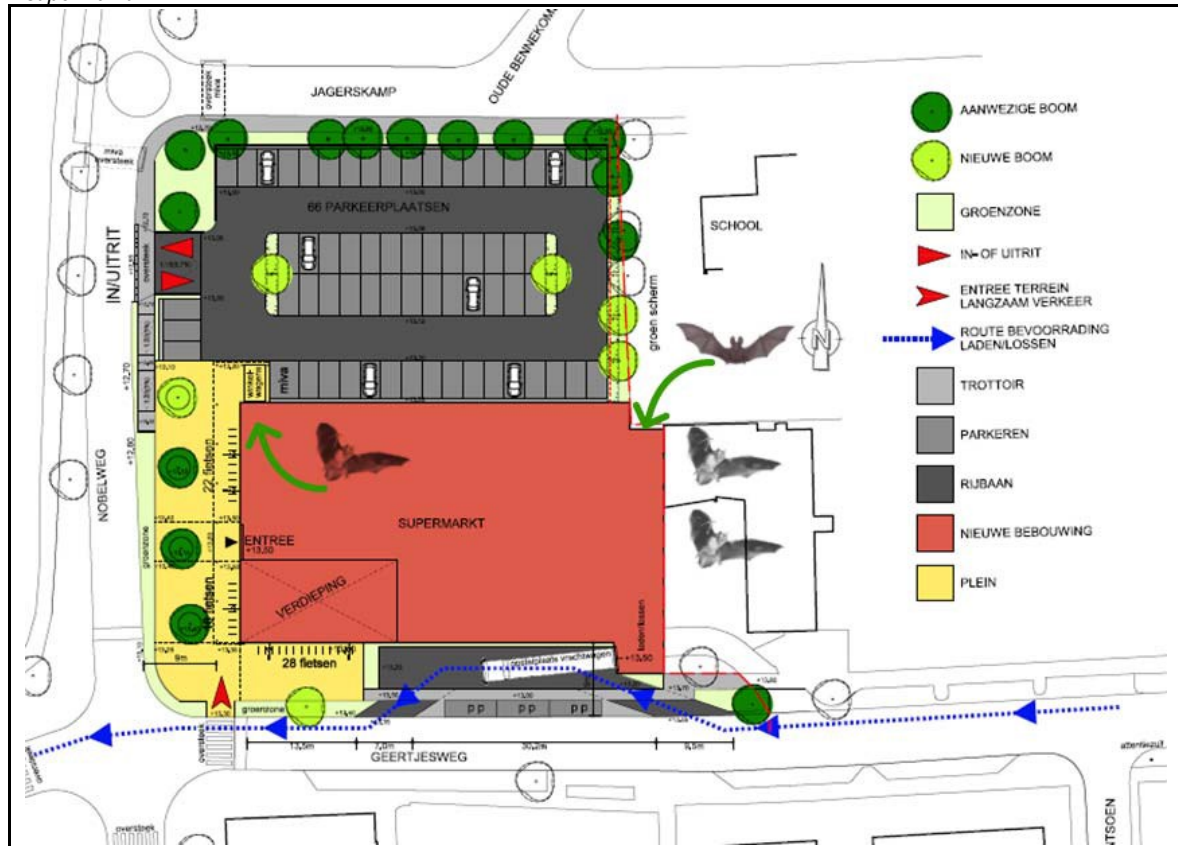
Figuur 4. Locaties van aan te brengen ingemetselde nestkasten of grote gevelkasten (groene pijlen) in de nieuwe supermarkt.