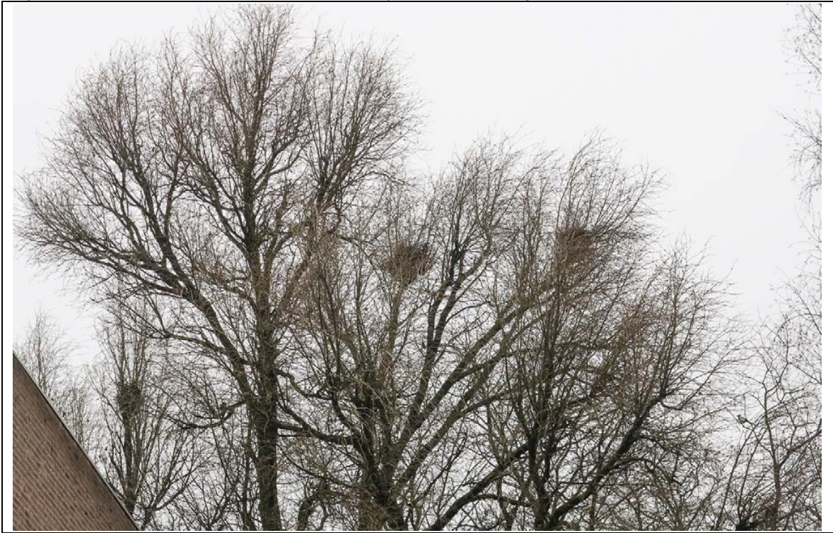
Figuur 3: Locaties van eksternesten aan de noord-oostzijde van het voormalige rouwcentrum 't Heem.