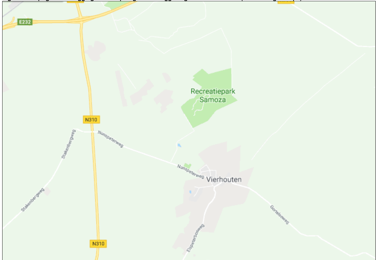
Figuur 2: Topografische ligging van de locaties waar bedrijfswijzigingen plaatsvinden.