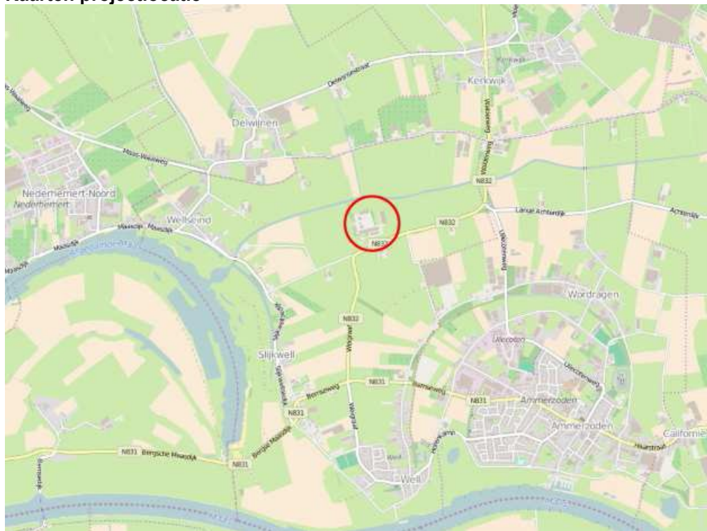
Figuur 1. Globale ligging plangebied (rood).