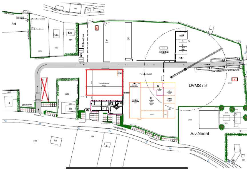
Figuur 2. Ontwerptekening van het Dura Vermeer terrein in Haften na uitvoering van de beoogde ontwikkelingen.