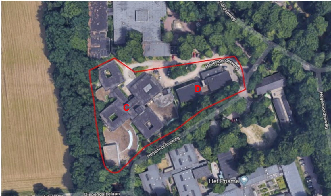
Figuur 1. Heijenoordseweg 7 te Arnhem (rood omlijnd). De verblijfplaatsen van vleermuizen zijn aangetroffen in gebouw D.