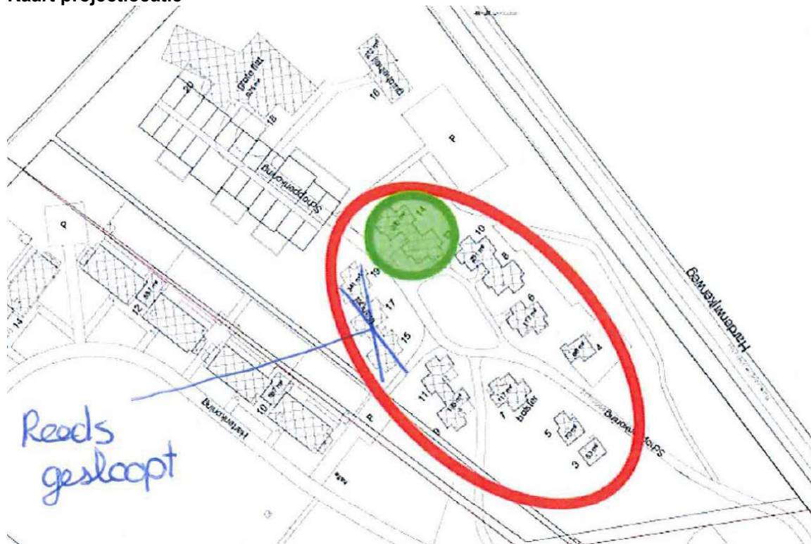
Figuur 1: Rood omcirkeld: plangebied. Groen omcirkeld: blijft behouden