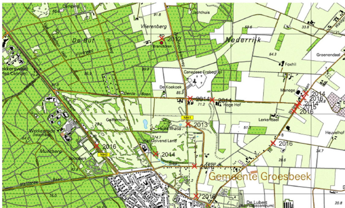
Figuur 3 Locaties verkeersslachtoffers dassen in 2012 tot en met 2016