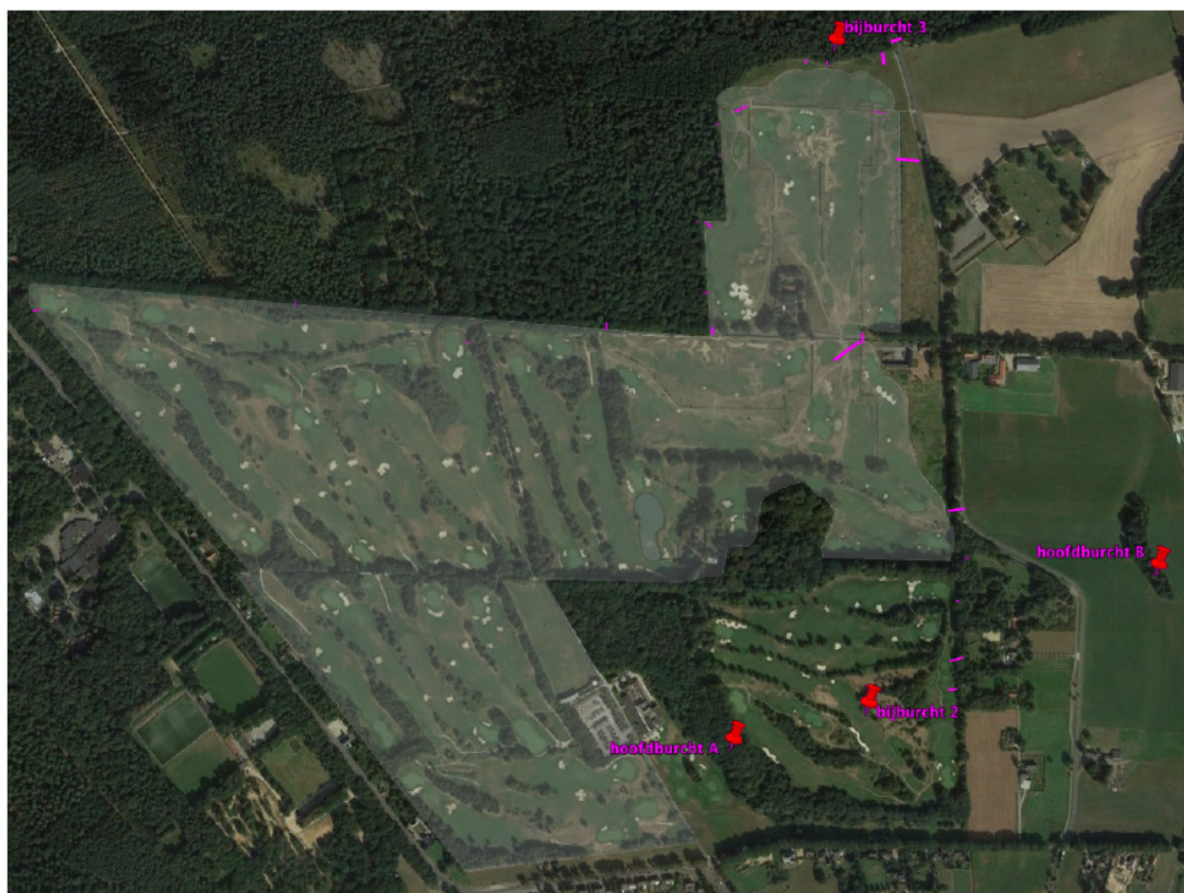
Figuur 1 Plangebied van af te schermen gebiedsdeel (wit)