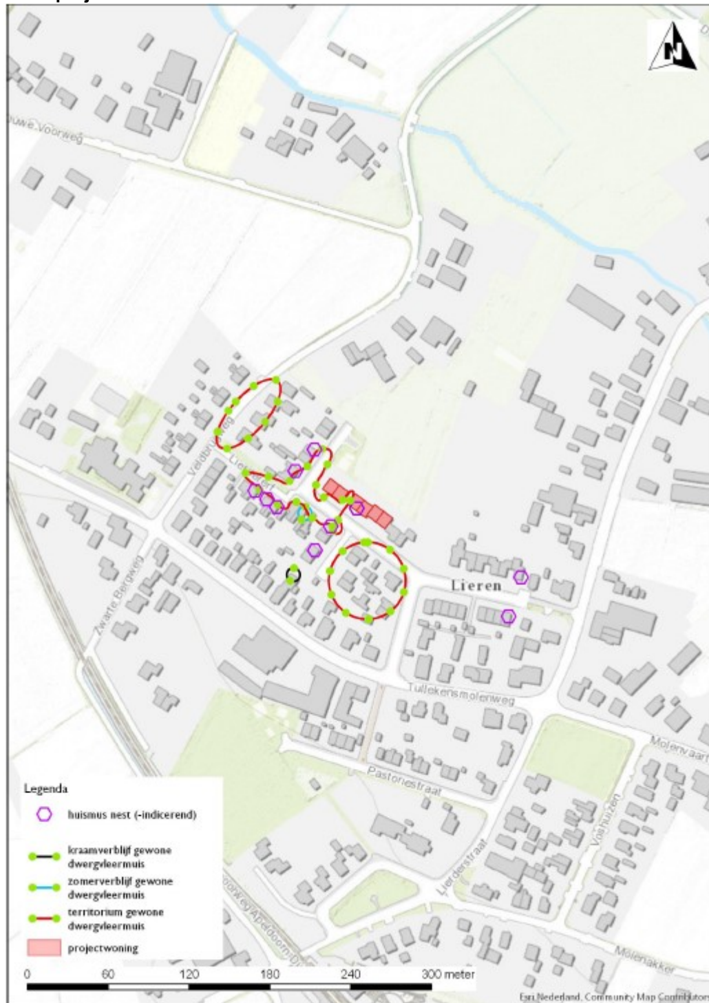
Fig 1: Te renoveren woningen (rood) Liedererf te Lieren (complex 1903) en onderzoeksresultaten nader onderzoek. Uit: Activiteitenplan Lieren complex 1903 (Looplan, 2019). Paarse hexagoon's zijn huismusnesten in de omgeving.