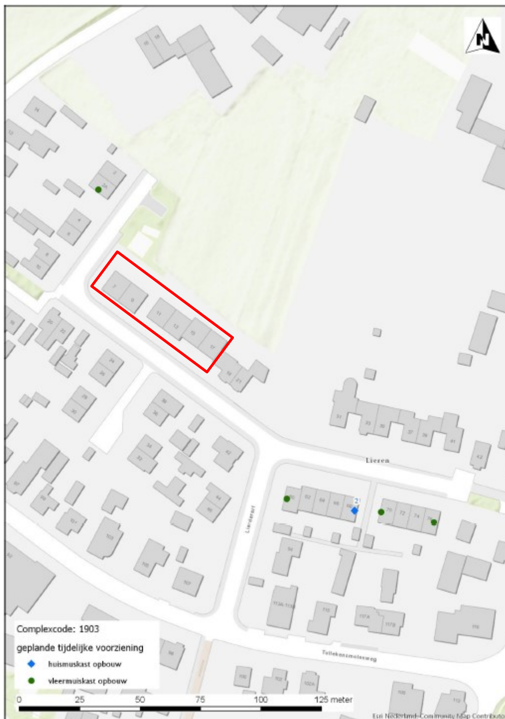
Figuur 1: Tijdelijke vleermuisverblijven (groene stippen) en huismuskasten (blauwe stip) t.o.v. het plangebied (rood kader)