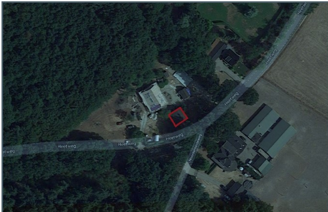
Figuur 2: Aanblik van de te slopen boerderij aan de Heetweg 12 te Kootwijk.

Figuur 1: Ligging van het plangebied, waarin de te slopen gebouwen aan de Heetweg 12 te Kootwijk gelegen zijn. De oude boerderij is gelegen binnen de rode contour.