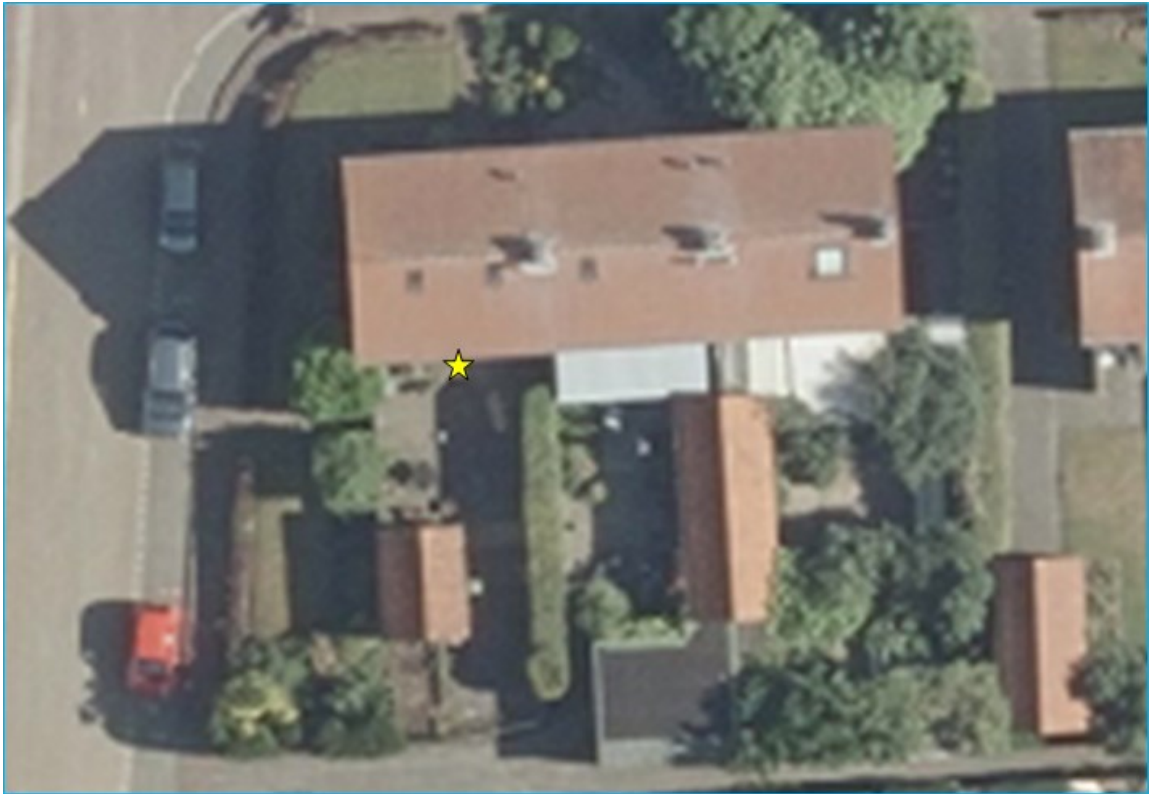
Figuur 1: Plangebied Berkenlaan 2, 4 en 6 te Warnsveld Gele ster: zomerverblijf gewone dwergvleermuis bij Berkenlaan 2