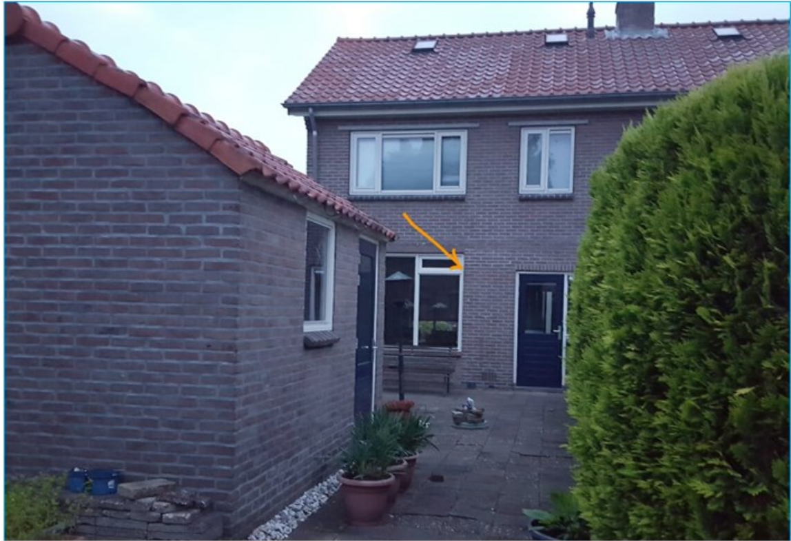
Figuur 2: Invliegplek gewone dwergvleermuis, Berkenlaan 2