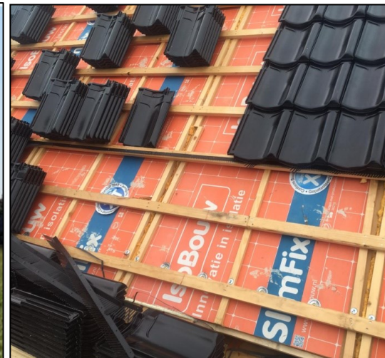
Figuur 2 Alternatieve voorzieningen, verhoogde vogelschroot op derde panlat aan de oost- en westgevel van de nieuwbouwwoning.