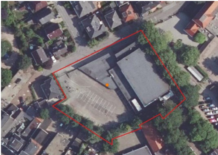
Figuur 1: Plangebied Van Huutstraat 3 te Apeldoorn met locatie verblijfplaats ruige dwergvleermuis; vleermuisonderzoek 2017 (EcoGroen, 2017)