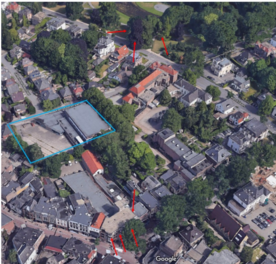
Figuur 1: Locaties tijdelijke verblijfplaatsen voor ruige dwergvleermuis aan bomen (boven) en voor de gewone dwergvleermuis aan gebouw voormalige Kijkshop (onder) t.o.v. plangebied (blauw). Locaties permanente verblijfplaatsen worden later nagezonden als ontwerp nieuwbouw gereed is.