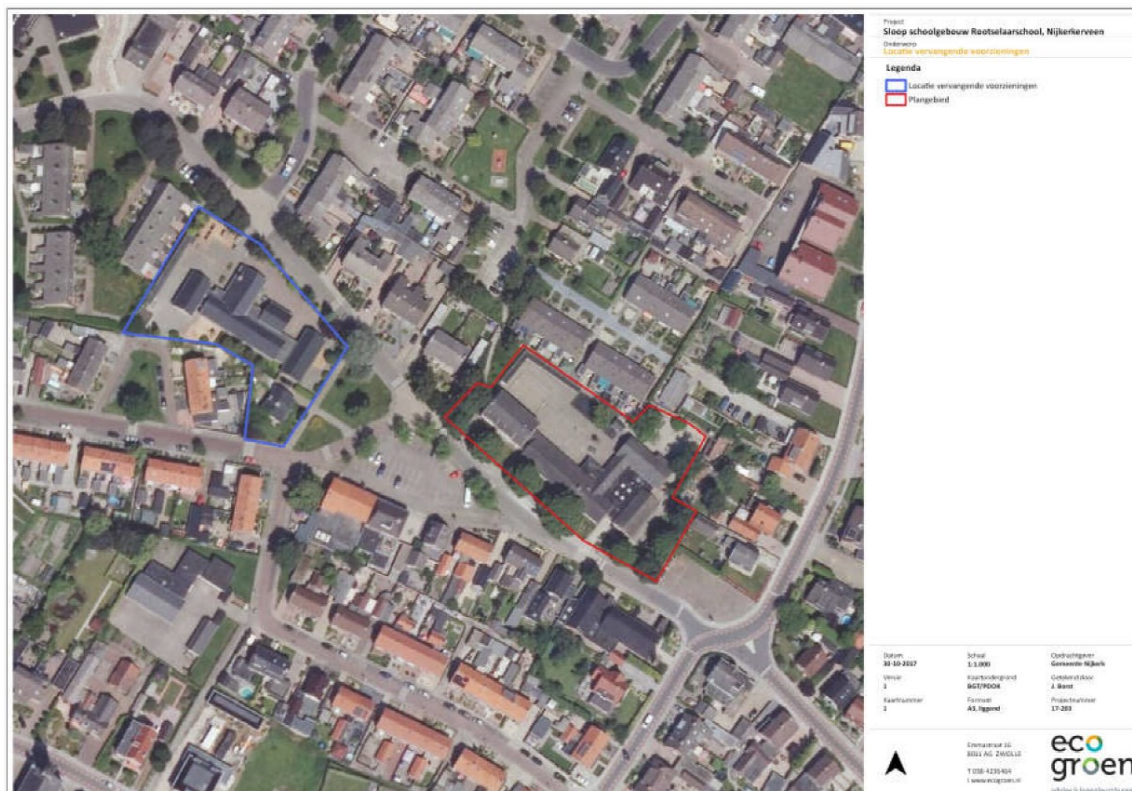
Figuur 3. Locatie permanente voorzieningen voor de huismus en gewone dwergvleermuis (blauwe kader) ten opzichte van de huidige nestlocatie en verblijfplaats in de Rootselaarschool.