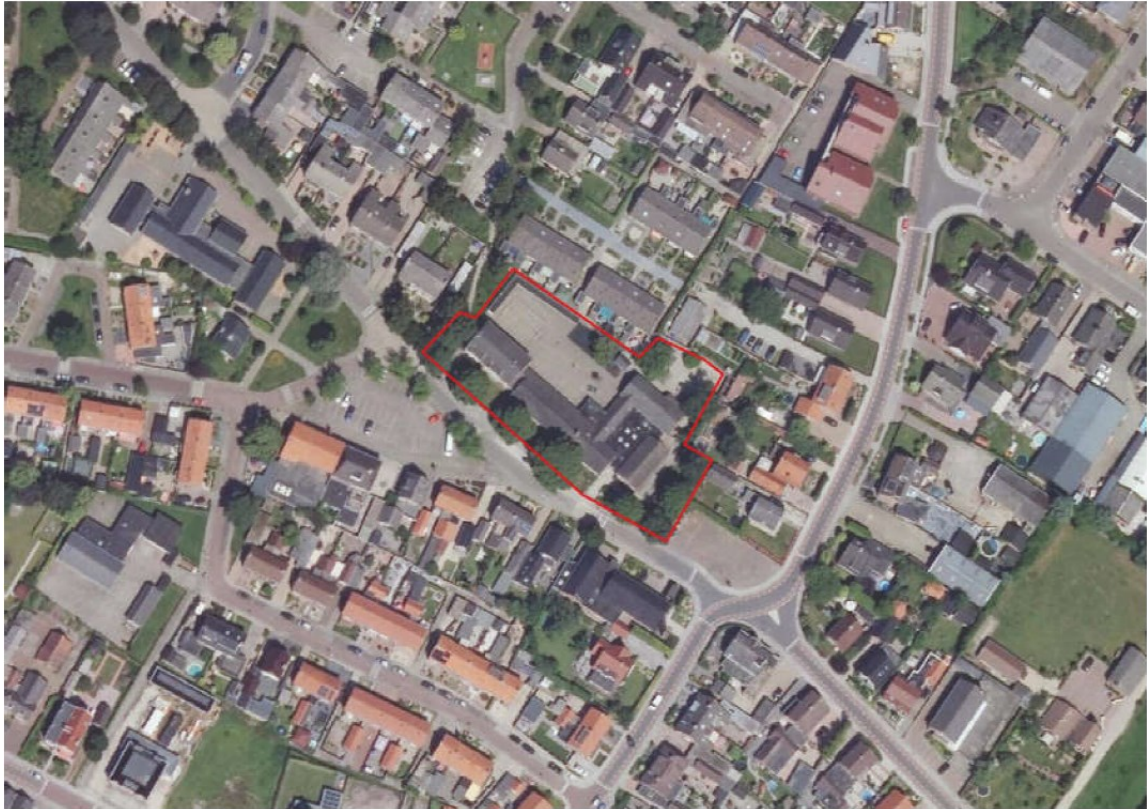
Figuur 1. Ligging en begrenzing plangebied Rootselaarschool aan de Van Noortstraat 42 te Nijkerkerveen.