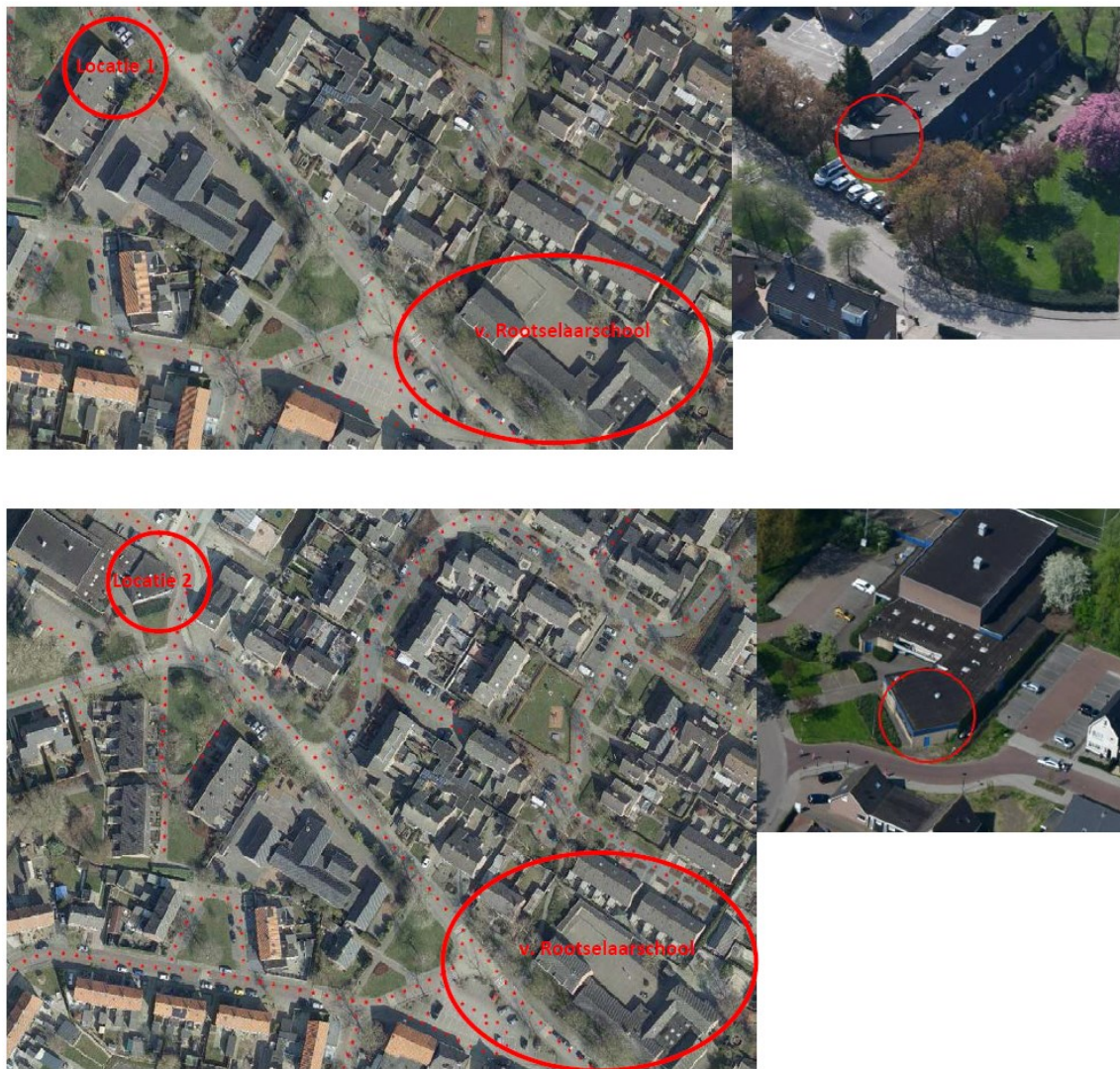
Figuur 2. Locaties tijdelijke huismuskasten (locatie 1 en 2) en vleermuiskasten (locatie 2) ten opzichte van de huidige nestlocatie van de huismus en de verblijfplaats van de gewone dwergvleermuis in de Rootselaarschool.