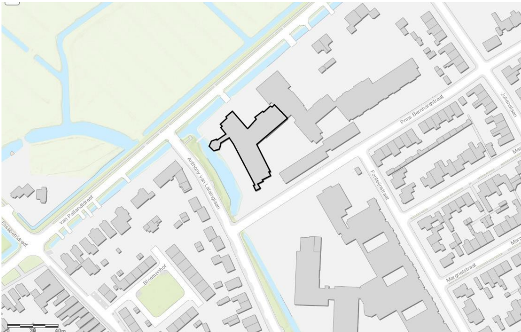
Figuur 1. Ligging plangebied aan de Van Pallandtdreef 10 te Culemborg, met zwart omlijnd de in twee fasen te slopen bebouwing.