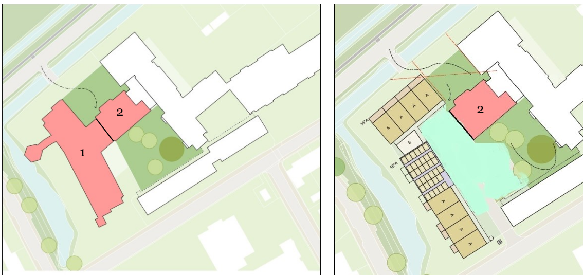
Figuur 2. Fasering sloop: Links het geheel te slopen gebouw fase 1 en 2; rechts het nog te slopen deel voor fase 2 (middendeel) en de nieuwbouw met parkeerplaatsen.