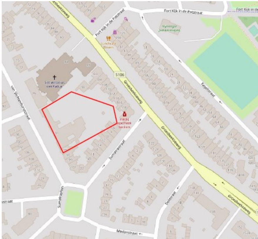
Figuur 2: Topografische ligging van plangebied Van Slichtenhorststraat 91, Nijmegen (Google Maps)