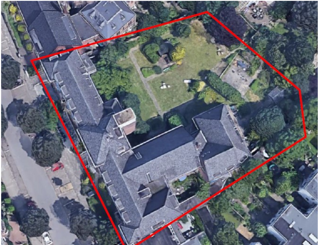
Figuur 1: Foto-impressie van plangebied Van Slichtenhorststraat 91, Nijmegen (Satellietfoto)