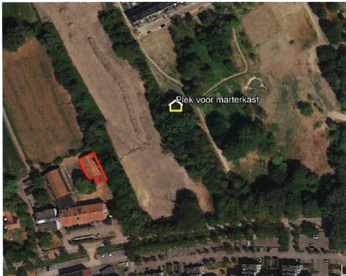
Figuur 3. Locatie alternatieve verblijfplaats steenmarter ten opzichte van het te slopen gebouw (rode lijn) met de huidige verblijfplaats van de steenmarter.