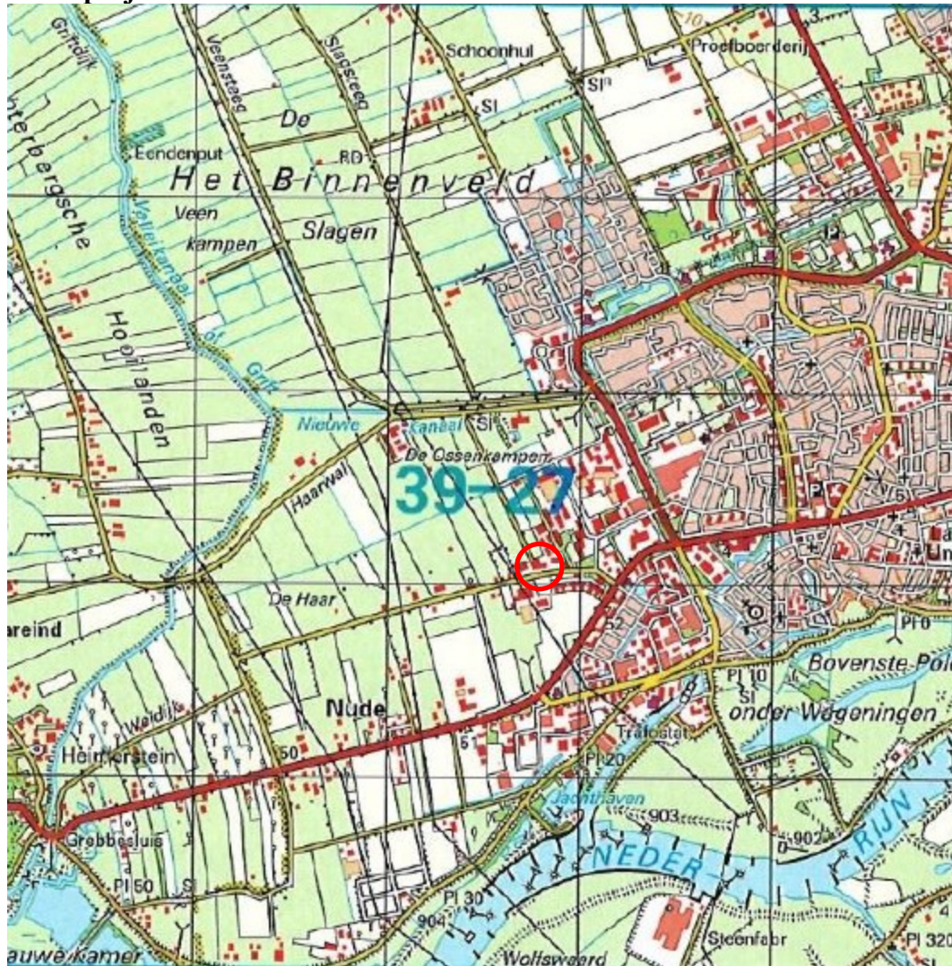
Figuur 1. Ligging plangebied Haarweg 10 te Wageningen (rode cirkel).