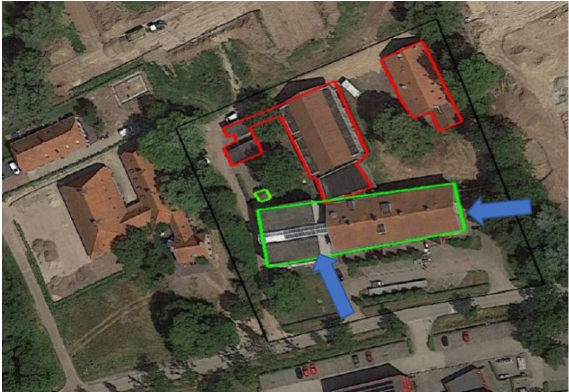
Figuur 2. Plangebied Haarweg 10 te Wageningen; de te slopen delen (rood omlijnd), het te handhaven deel (groen omlijnd) en de locaties waar vleermuiskasten zijn opgehangen (blauwe pijlen). Per locatie zijn twee vleermuiskasten opgehangen.