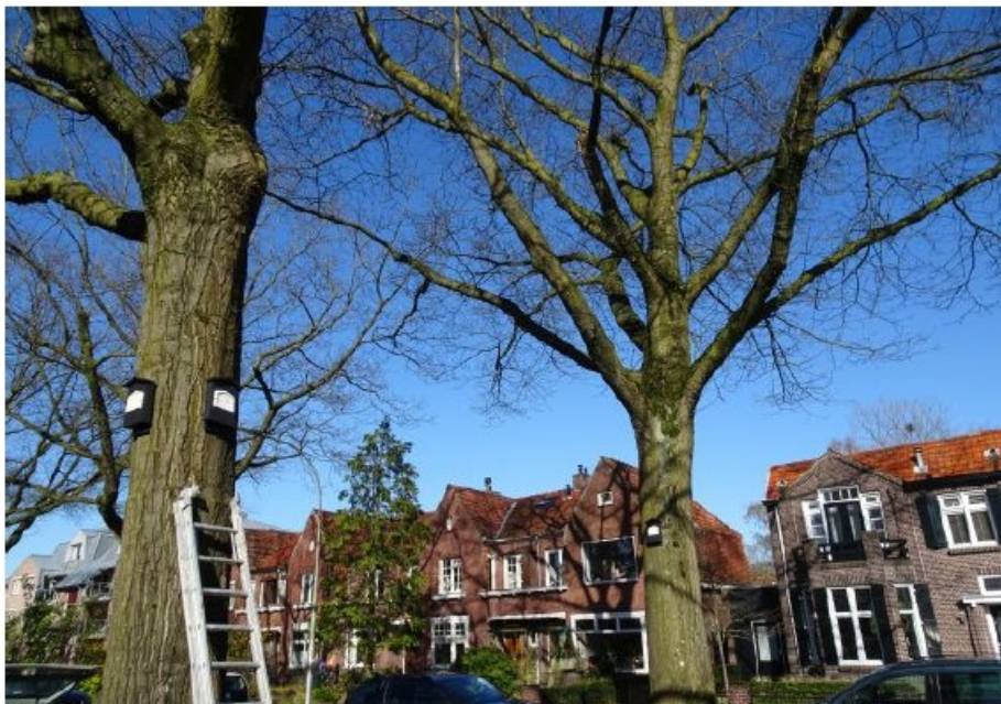
Figuur 2. Vleermuiskasten zoals die aan de bomen op de Hazekampseweg zijn opgehangen.