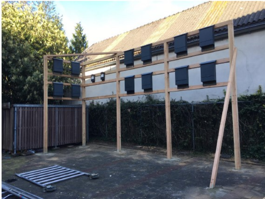
Figuur 3. De stellage zoals die is geplaatst op de locatie blauw in figuur 1.