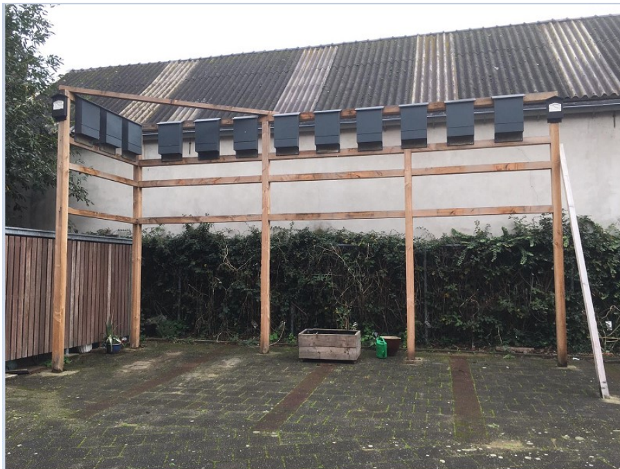
Figuur 4 De kisten zoals die nadien (november 2020) op de stellage zijn bevestigd.