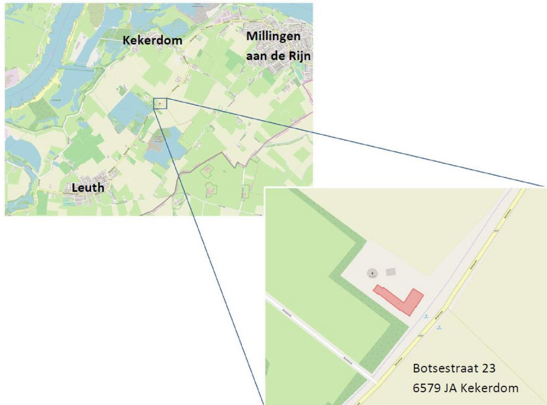
Figuur 1. Ligging van het plangebied aan de Botsestraat 23 te Kekerdom. Het te slopen gebouw met schuur is rood gemarkeerd.