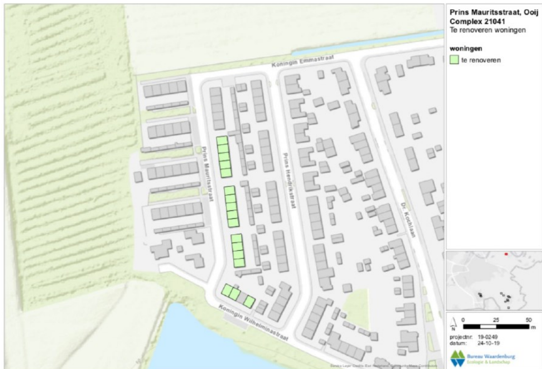
Figuur 1 Het plangebied in lichtgroen weergegeven.