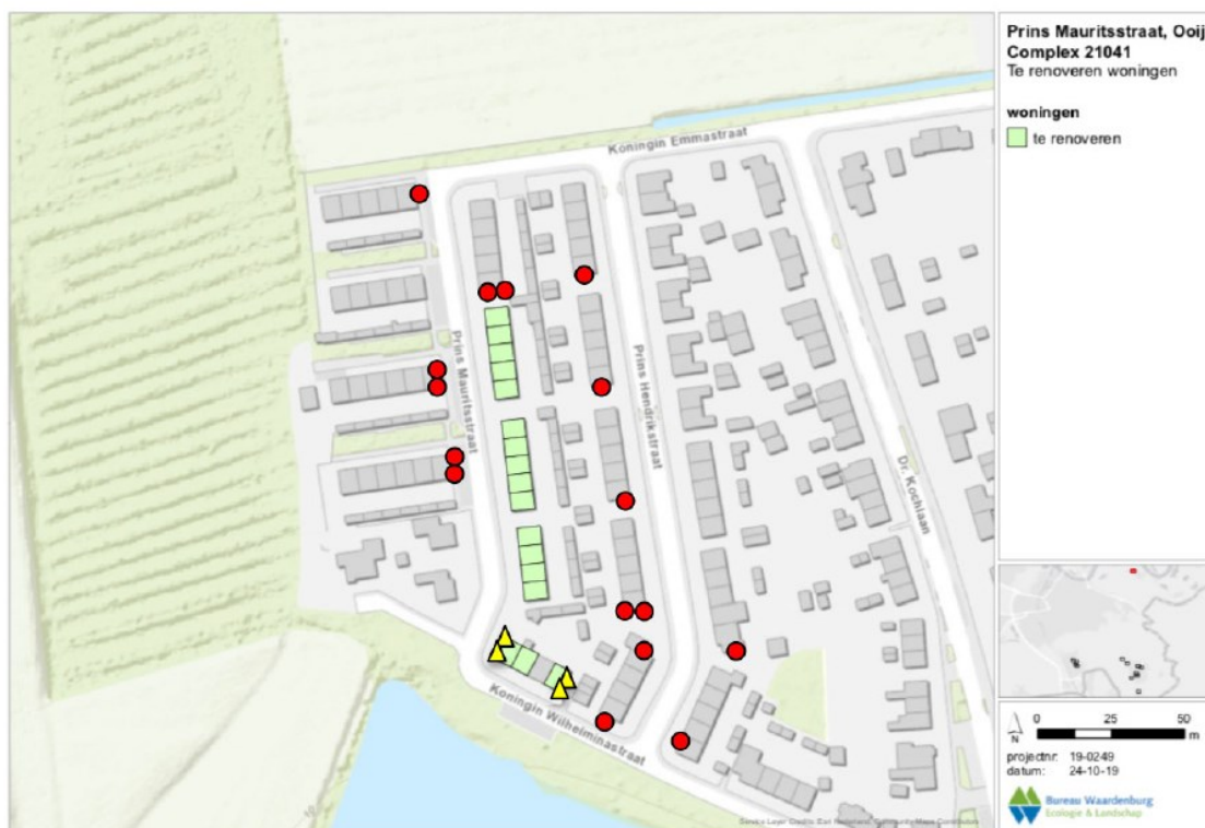
Figuur 2 Locaties van de tijdelijke voorzieningen voor vleermuizen (rood). Waar twee vleermuiskasten op een gevel zijn geprojecteerd, worden ze links en rechts met de ingang van de kast ter hoogte van de dakgoot geplaatst. De kasten komen niet naast elkaar te hangen. Daarnaast zijn de locaties van 4 van de 28 inbouwnestkasten voor de gierzwaluw aangegeven (geel).