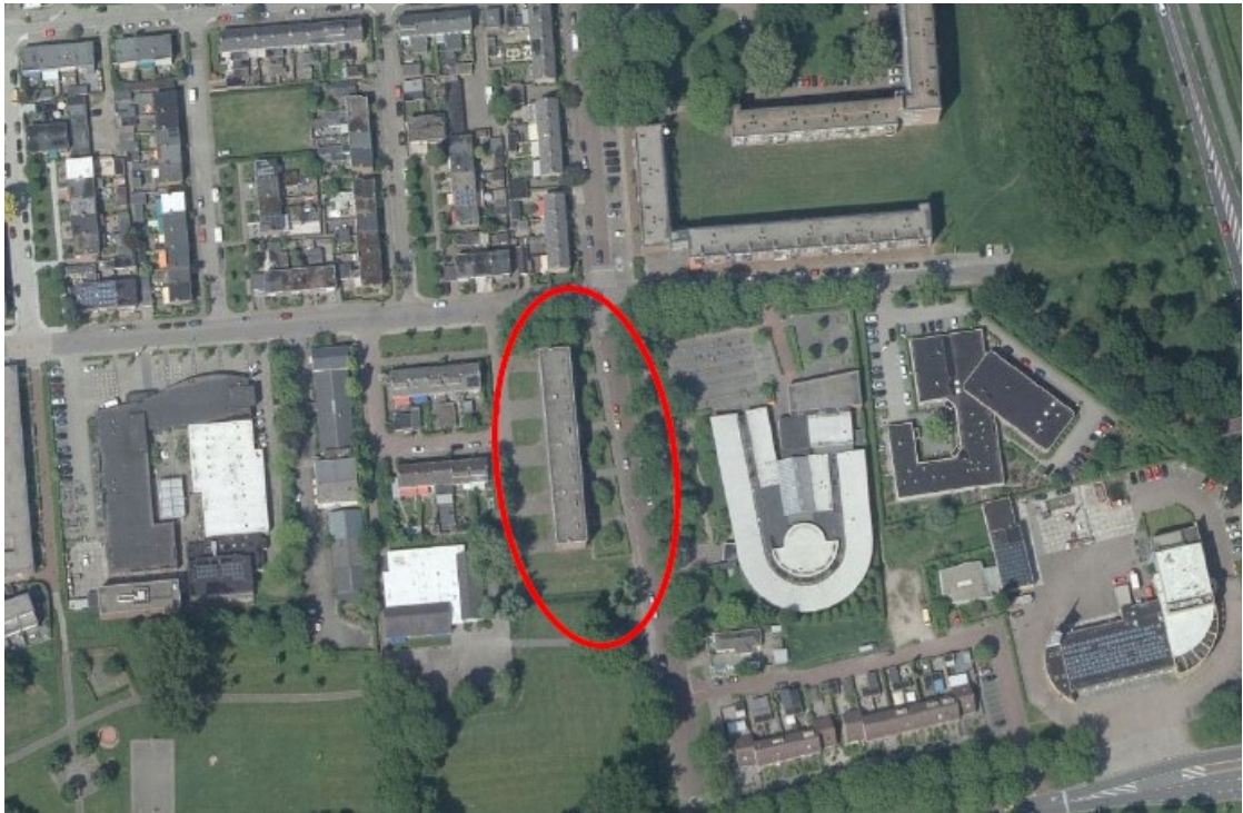
Figuur 1: Plangebied Berkenlaan 58-104, Zutphen