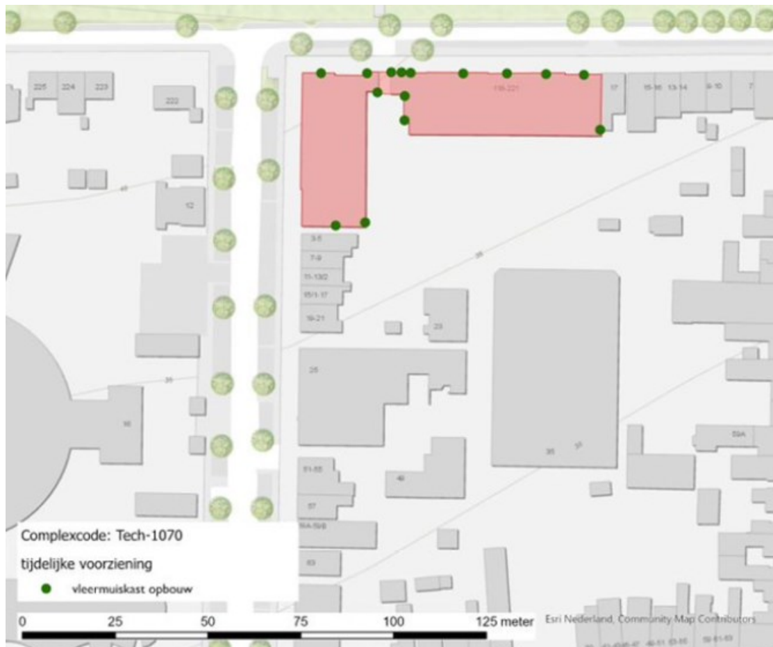
Figuur 3: Toegevoegde 15 vleermuiskasten