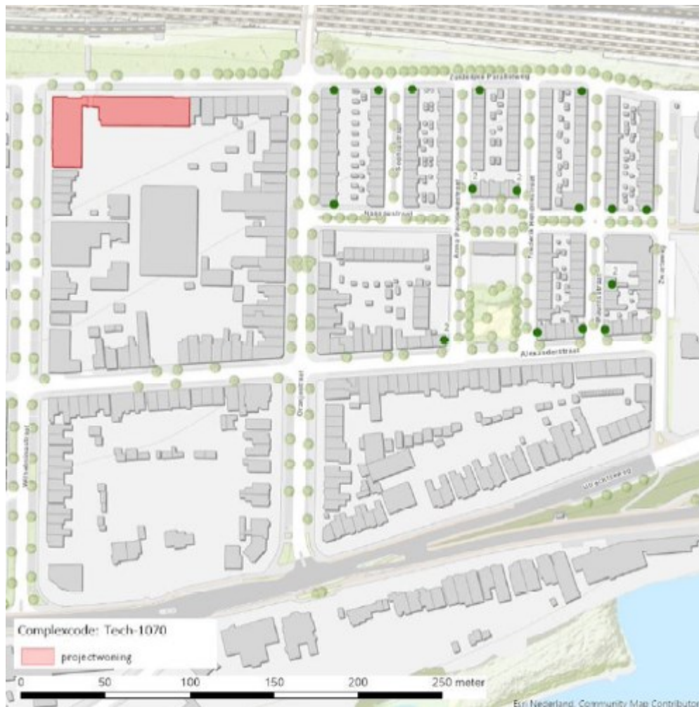
Figuur 2: Locatie van de eerste 20 tijdelijke alternatieven (bij stippen met een 2 hangen 2 vleermuiskasten)