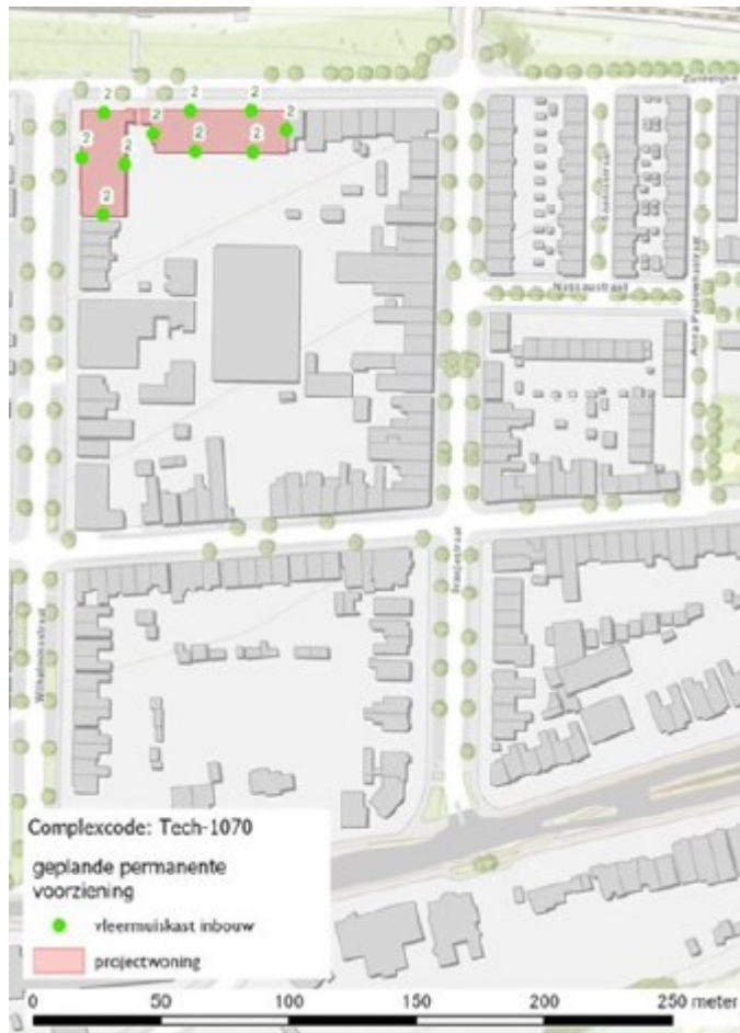
Figuur 4: Permanente voorzieningen