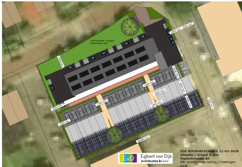
Figuur 1 locatie appartementengebouw met 20 woningen