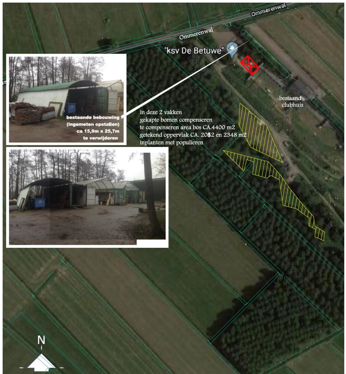
Figuur 2: Ligging compensatielocatie herplantplicht (met gegevens gemeente Ommeren, sectie D, nummer 124 en 47).