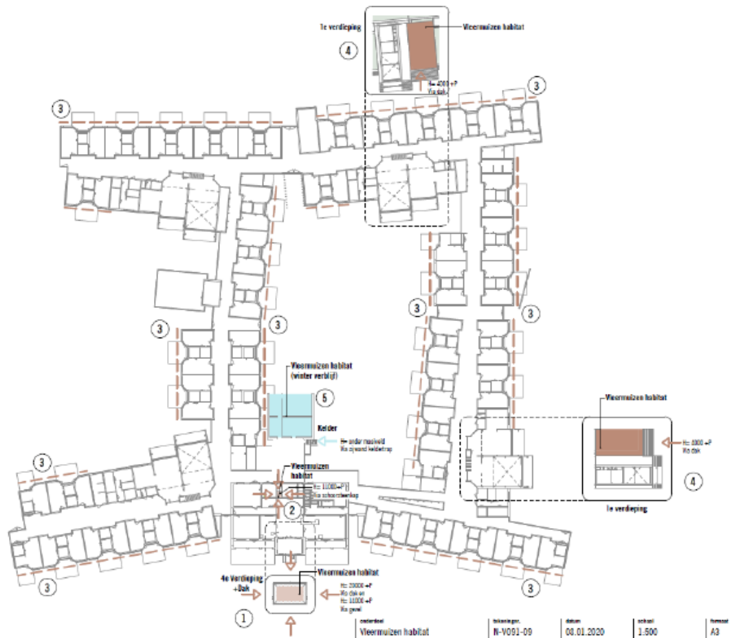
Figuur 2: Permanente mitigatie. De nummers verwijzen naar de nummers in tabel 2.