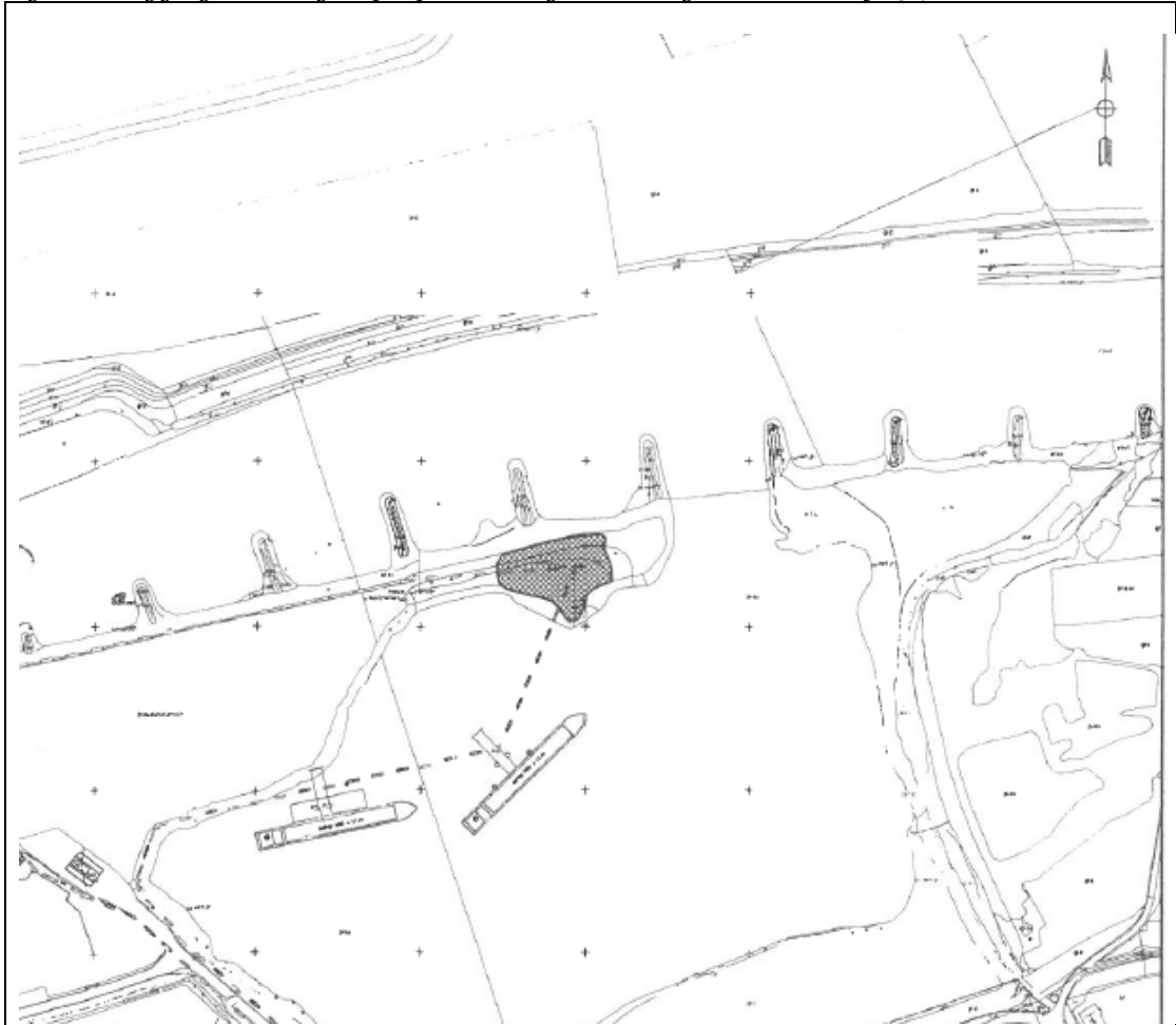
Figuur 1: Ligging van het gekapte perceel wilgen ter hoogte van IJsseldijk 3-7 te Westervoort.