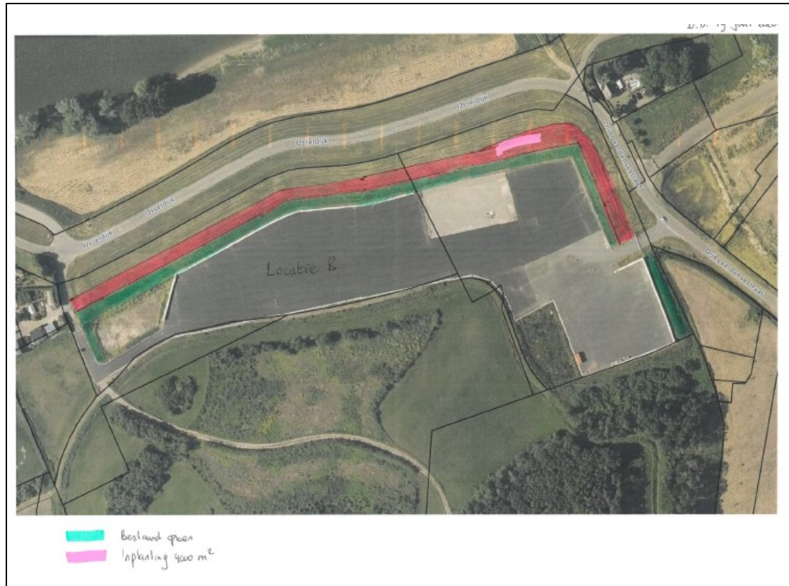
Figuur 2: Ligging van de te beplanten stroken volgens gemeentelijke afspraken (de groene arcering) en volgens de provinciale herplantplicht (de rode arcering, 4000 m 2 ).