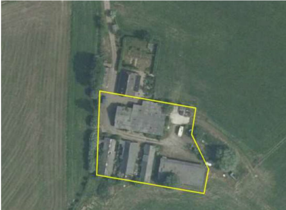
Figuur 1 Plangebied