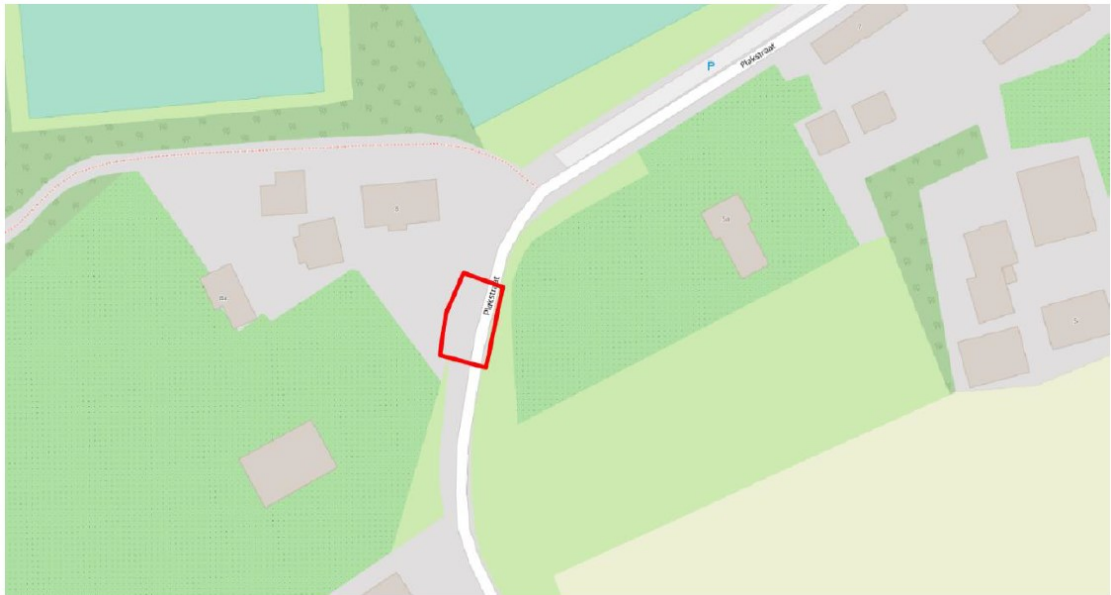
Figuur 1. Ligging twee te kappen populieren ter hoogte van de Plakstraat 8 te Winssen.