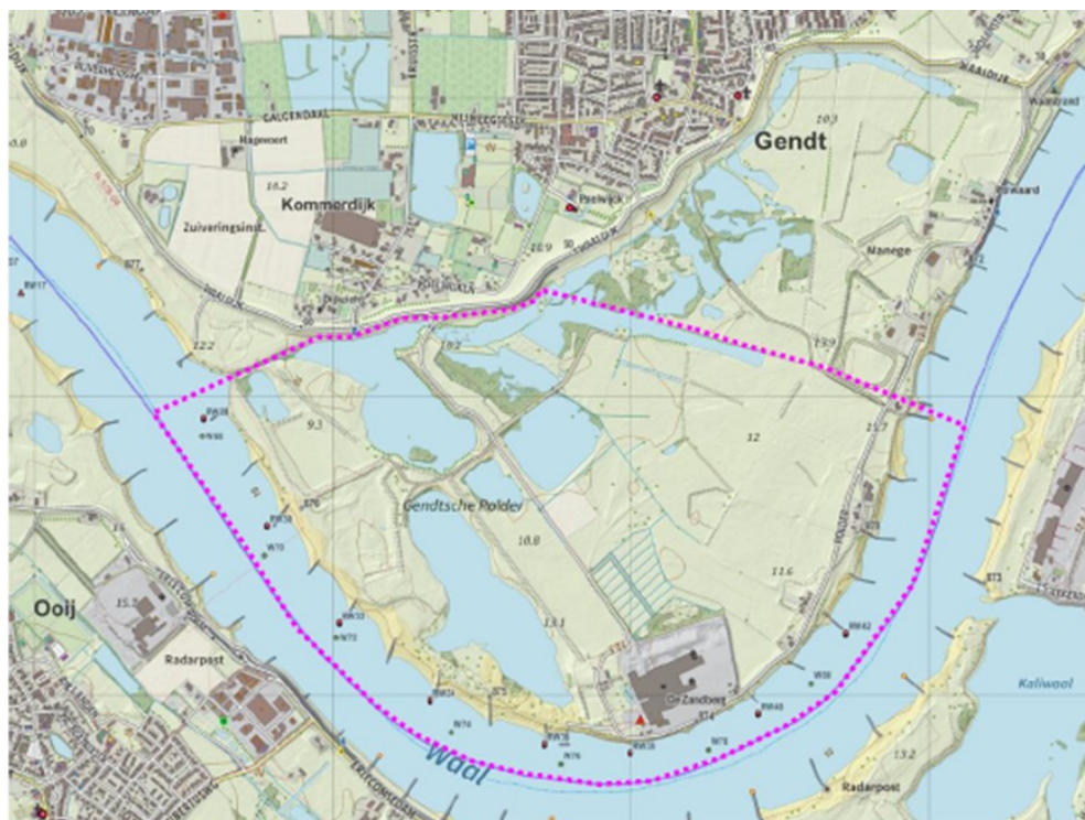
Topografische kaart van de Gendtse Waard (plangebied in roze)

Het gebied waar de herinrichting plaatsvindt betreft het westelijke gedeelte van de Gendtse Waard. Het plangebied is totaal ongeveer 220 hectare (ha.) groot; de feitelijke ontgraving bedraagt ongeveer 53 ha. Het plangebied is weergegeven op onderstaande topografische kaart.