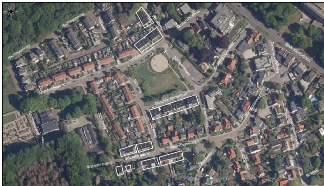
Figuur 1 Kaart van het projectgebied (Econsultancy, 2021).