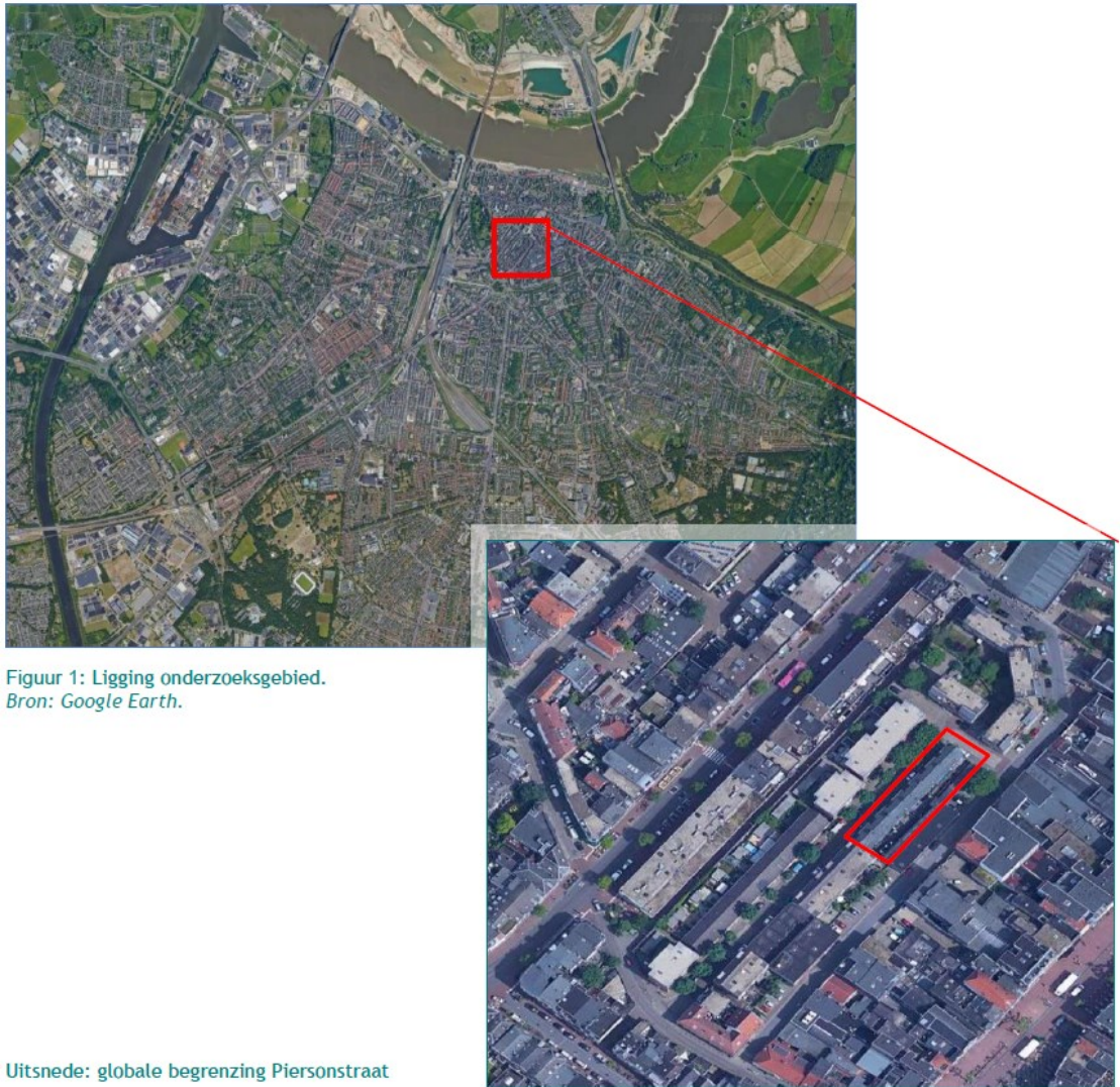
Figuur 1: Ligging onderzoeksgebied.

Figuur 1. Ligging en begrenzing plangebied aan de Piersonstraat 33 t/m 51 te Nijmegen.