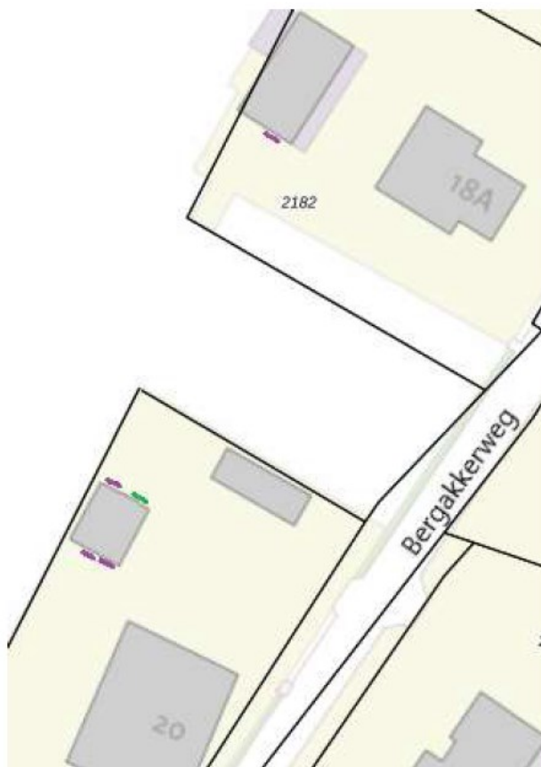
Figuur 1: tijdelijke mitigerende maatregelen

De mitigerende maatregelen voor vleermuizen en mussen worden gerealiseerd aan de Noordwestzijde van het perceel 2102, waarop de te renoveren boerderij ligt en op de Zuidwestzijde van perceel 2182.