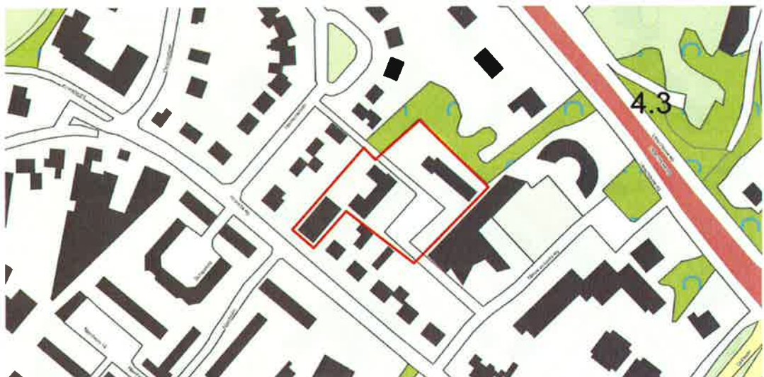
Figuur 1. Ligging van het plangebied, met de begrenzing in rood aangegeven.

Het plangebied omvat twee schoolgebouwen, een gymzaal en een buitenruimte van de scholen. De buitenruimte is voornamelijk verhard met tegels. Een deel van het plangebied bestaat uit groene structuren zoals bomen en struiken. De twee schoolgebouwen zijn twee verdiepingen hoog en hebben een dak met dakpannen en een spouwmuur. De gymzaal heeft een plat dak en een spouwmuur.