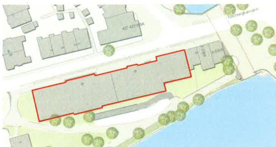
Figuur 2. Omlijning van het plangebied met de twee panden aan Bijhouwerstraat 6 en 8 te Utrecht.