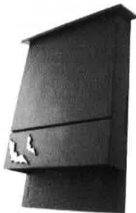
Figuur 8. Voorbeeld vleermuiskast geschikt voor kraamkolonies.

Na afronding van de werkzaamheden wordt een grote kast opgehangen die geschikt is als kraamverblijfplaats van gewone dwergvleermuizen (Figuur 8). Voor deze kast is gekozen doordat met uitgevoerd onderzoek niet werd aangetoond dat de panden door gewone dwergvleermuizen worden gebruikt als kraamverblijfplaats en het soort verblijf wenselijk is vanuit gemeente Utrecht. Op deze wijze wordt extra stimulans gegeven aan mogelijke verblijfplaatsen en voortplantingslocaties van gewone dwergvleermuizen.