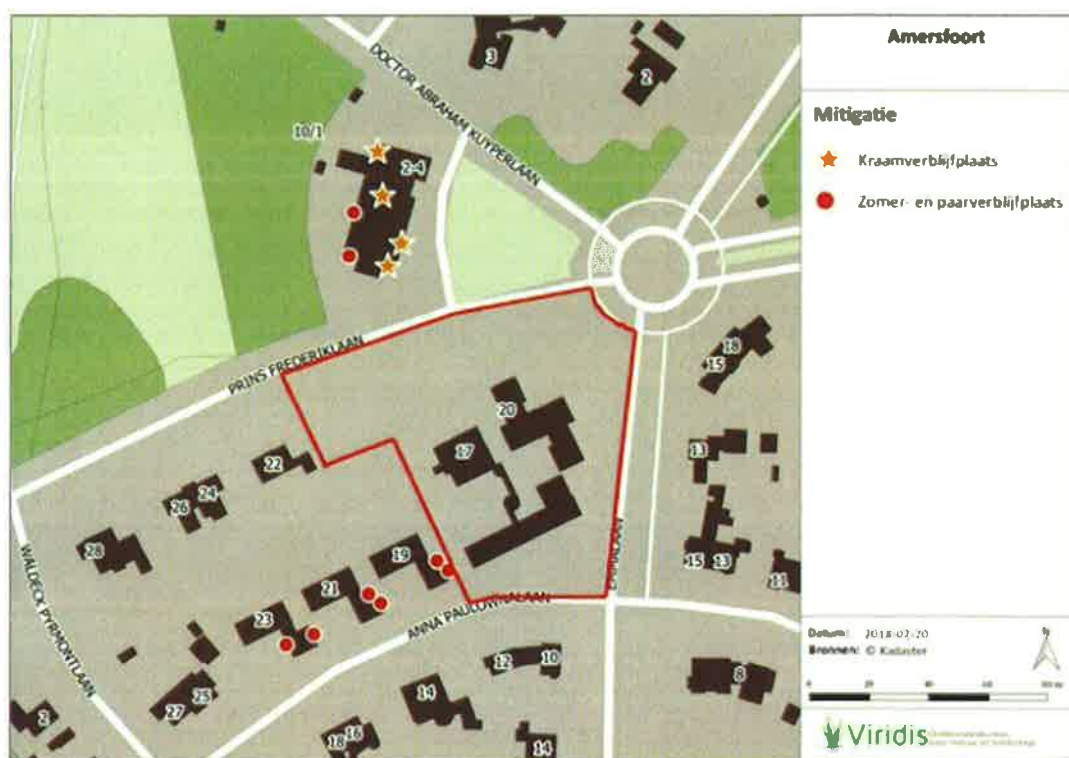
Figuur 6.1 | Overzicht van de aangebrachte mitigerende maatregelen in de directe omgeving van het plangebied (rood omkaderd)