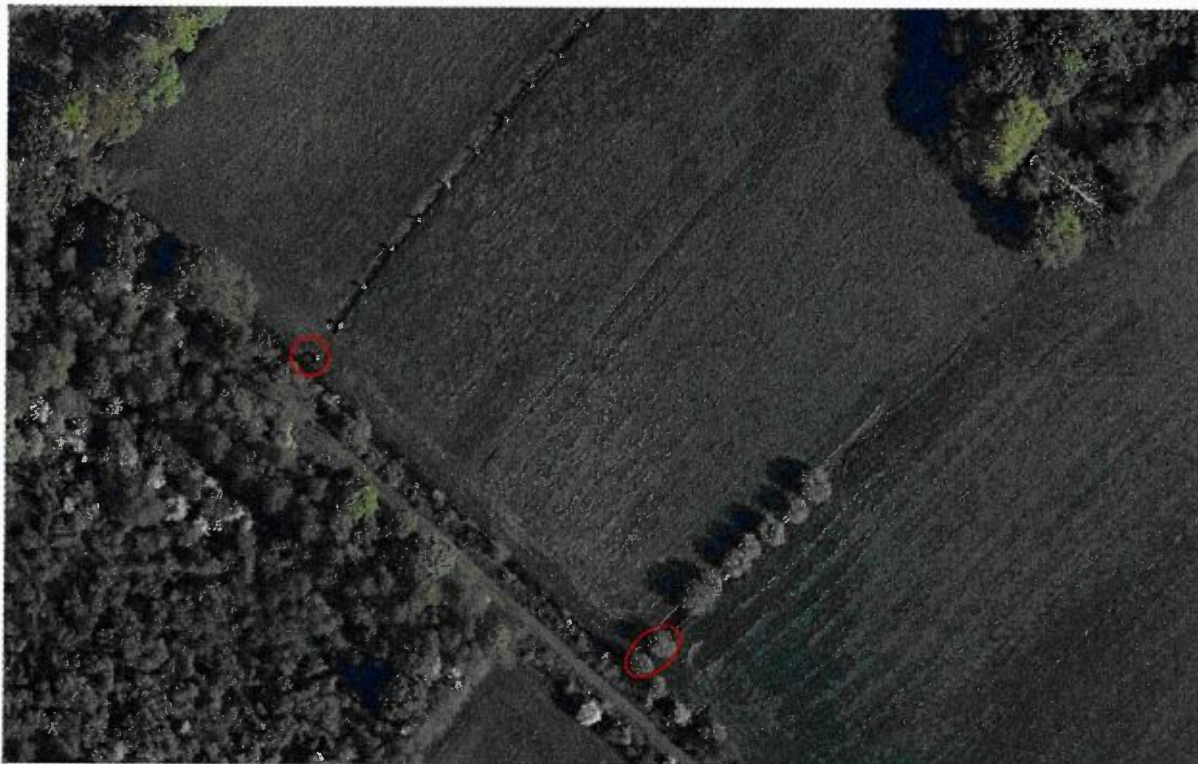
Figuur 3: kaart met de te kappen bomen (rood omcirkeld).

Gelet op het voorgaande heffen wij onder voorwaarden de beschermde status van drie knotwilgen uit het beschermde landschapselement (03550002 en 03550003) op en stemmen daarmee in met de kap van deze drie knotwilgen.