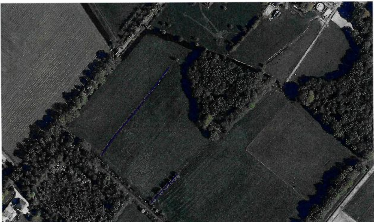
Figuur 3: kaart met als paarse lijnen de locatie van de betreffende elementen. Het noordelijke element betreft 03550003, het zuidelijke element betreft 03550002.