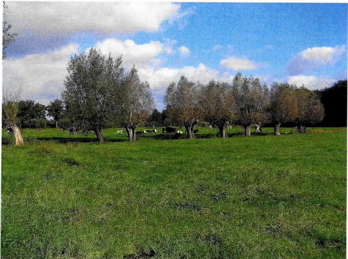
Figuur 1: foto van het element 03550002