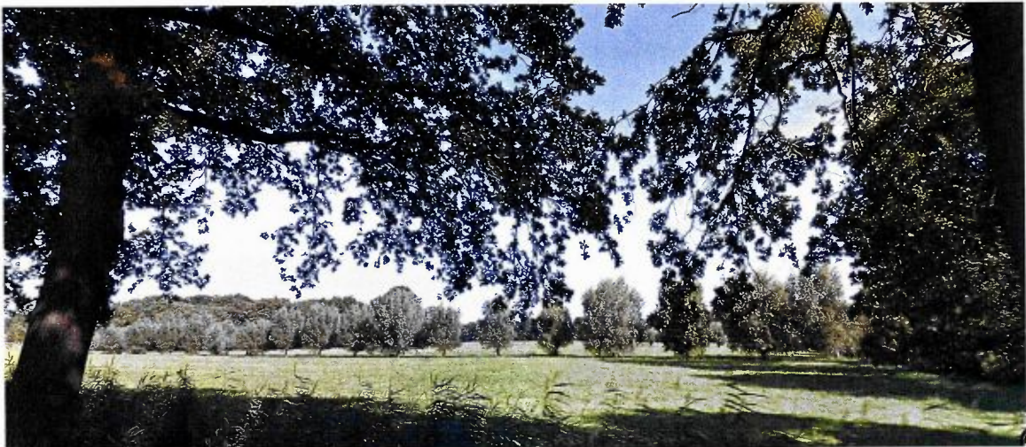
Figuur 2: foto van het element 03550003