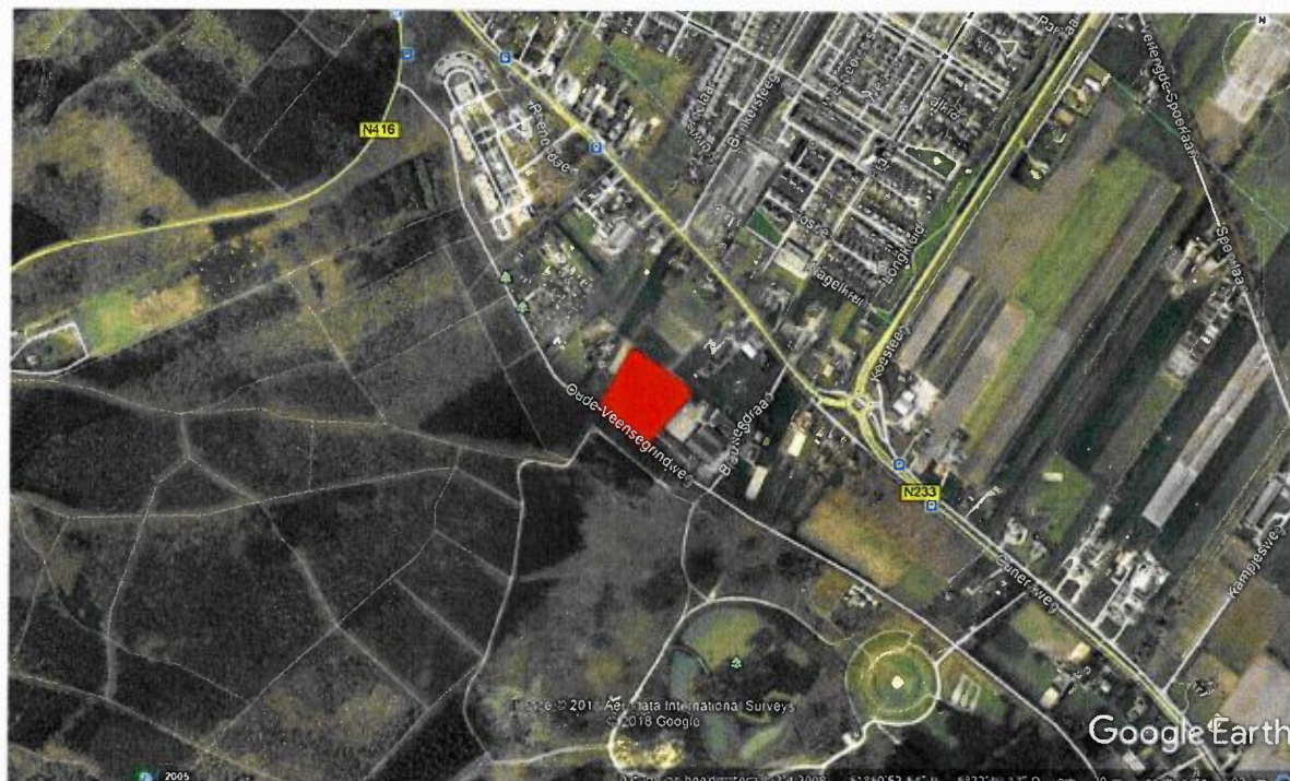
Bijlage 2: kaart plangebied