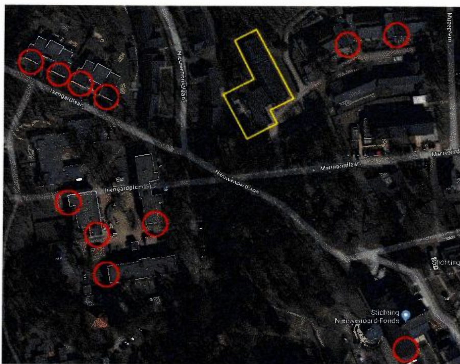
Figuur 11. Potentielle locaties voor mitigatie binnen 200 meter van het plangebied.