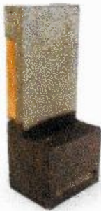
Figuur 10. Vivara pro IB VL 01 met een invliegopening en één verblijfsdeel.

Als vervanging van de verblijven worden vier inbouwstenen IB VL 01 (fig. 10) van Vivara pro toegepast in gebouwen rond het plangebied. De locaties van de stenen zijn nog niet bepaald. Dit gebeurt op korte termijn in samenwerking met de opdrachtgever. In figuur 11 zijn potentiële locaties voor mitigatie aangegeven. Het gaat om de hogere gemetselde gevels met een gunstige ligging ten opzichte van de zon.