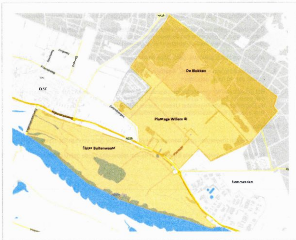
Figuur 3: Leefgebied Plantage Willem III–Remmerdense Heide en Elster Buitenwaard

De ontheffing geldt voor het aangewezen leefgebied Plantage Willem III–Remmerdense Heide en Elster Buitenwaard, zoals aangegeven op onderstaand kaart, voor de duur van het Faunabeheerplan 2019-2025.