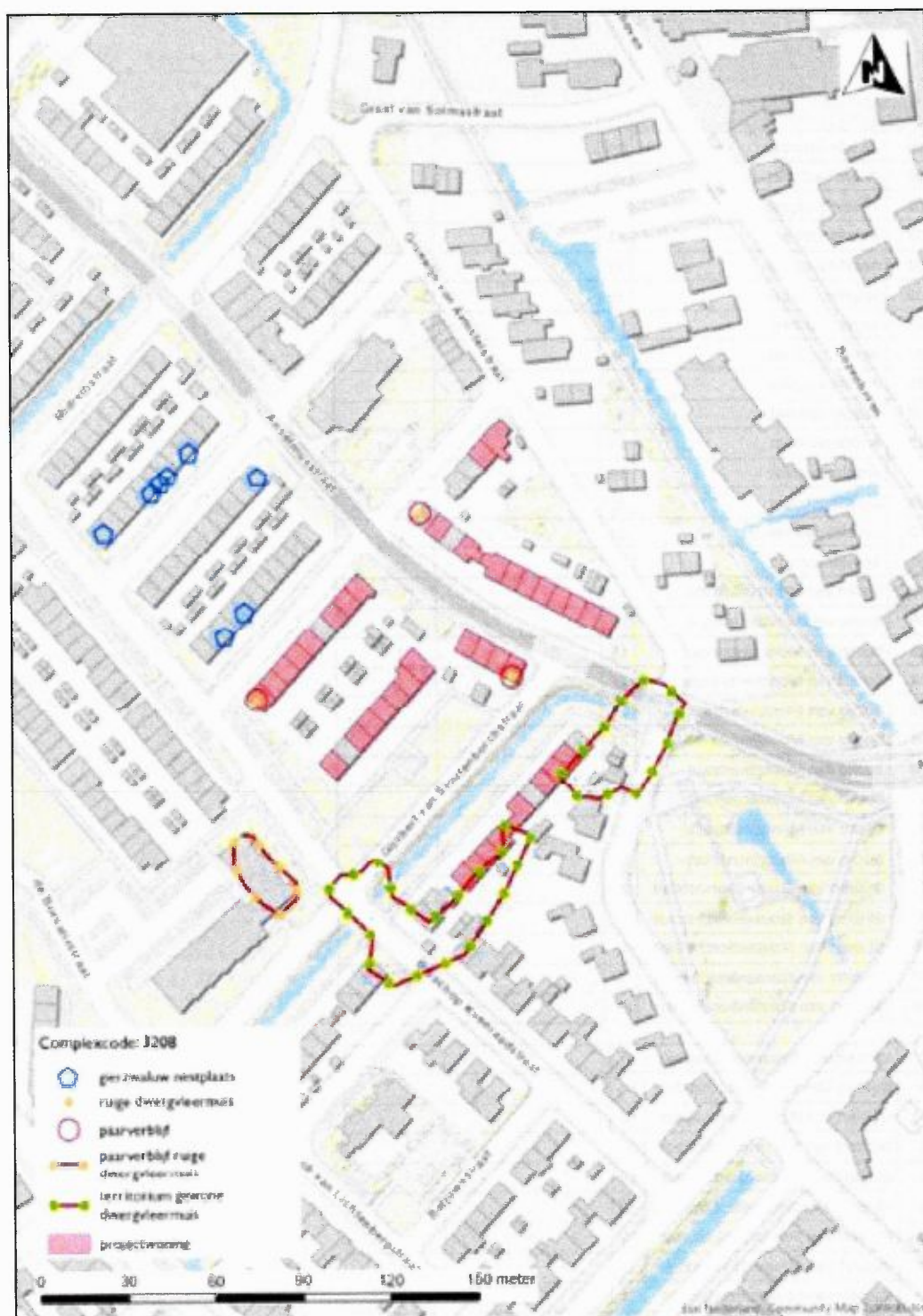
Figuur 4: Verblijfplaatsen aangetroffen beschermde soorten Anselmusstraat.