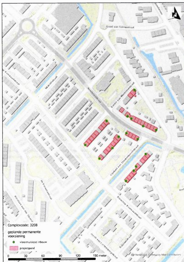
Figuur 3: Kaart geplande locaties permanente mitigerende voorzieningen complex 3208 in Mijdrecht.

Zie de bijgevoegde kaart (figuur 3). Op elke kopgevel is nu één inbouwkast VMPM2 gepland, in totaal 13 kasten. De overige 3 kasten staan gepland op de voorzijdes (of eventueel achterzijdes) van verschillende woningen. Het gaat hier nog steeds om geplande locaties. Door de omliggende beplanting die de invliegruimte kan beperken of weerstand van bewoners kan de uiteindelijke locatie nog steeds afwijken van de planning. Als dit het geval is, wordt naar een ecologisch verantwoorde nieuwe locatie gekeken en wordt dit geregistreerd in het ecologisch logboek.