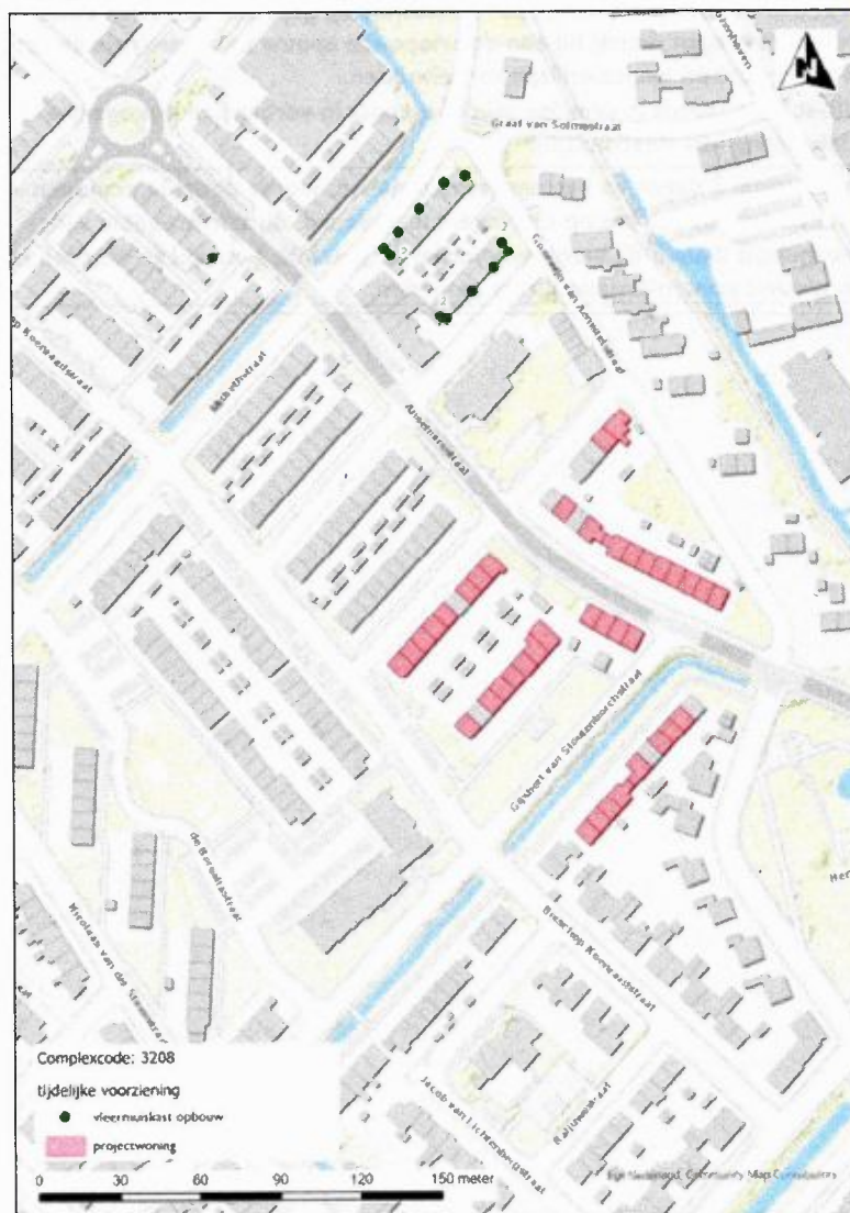
Figuur 2: Kaart met tijdelijke mitigerende voorzieningen voor complex 3208 in Mijdrecht.

Ten aanzien van tijdelijke compenserende verblijfplaatsen voor de ruige dwergvleermuis (aanvullend op maatregelen genoemd in bijlage 4):