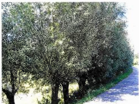
Figuur 3: foto van het betreffende element

locatie: Gemeente Oudewater, (zoals weergegeven op de bijgevoegde kaart bij nummer 4) aan de Zuid-Linschoterzandweg te Snelrewaard, landschapstype: Groene Hart, benaming: wegbeplanting, hoofdboomsoort: knotwilg, lengte: het gehele element is 650 meter lang, slechts een deel hiervan betreft de te kappen bomen, breedte: 4 meter, oppervlakte: 2600 m 2 , geschat aantal bomen: meer dan 200 stuks, volledigheid: 100 %, vitaliteit: vitaal, leeftijd: 15-60 jaar, cijfer leeftijd: 2.