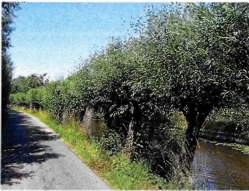
Figuur 1: foto van het betreffende element