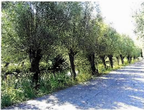
Figuur 5: foto van het betreffende element