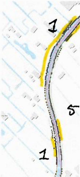
Figuur 6: kaart met paarse lijn die het beschermde element weergeeft. De gele strepen (bij de nummers 1) geeft de locatie van de te kappen bomen aan.