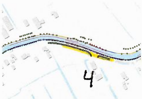
Figuur 4: kaart met paarse lijn die het beschermde element weergeeft. De gele streep (bij nummer 4) geeft de locatie van de te kappen bomen aan.

locatie: Gemeente Oudewater, (zoals weergegeven op de kaart bij de nummer 1) aan de Noord-Linschoterzandweg te Snelrewaard, landschapstype: Groene Hart, benaming: wegbeplanting, hoofdboomsoort: knotwilg, lengte: het gehele element is 450 meter lang, slechts een deel hiervan betreft de te kappen bomen, breedte: 4 meter, oppervlakte: 1800 m 2 , (geschat) aantal bomen: circa 100 stuks, volledigheid: 85 %, vitaliteit: vitaal, leeftijd: 30-50 jaar, cijfer leeftijd: 2.