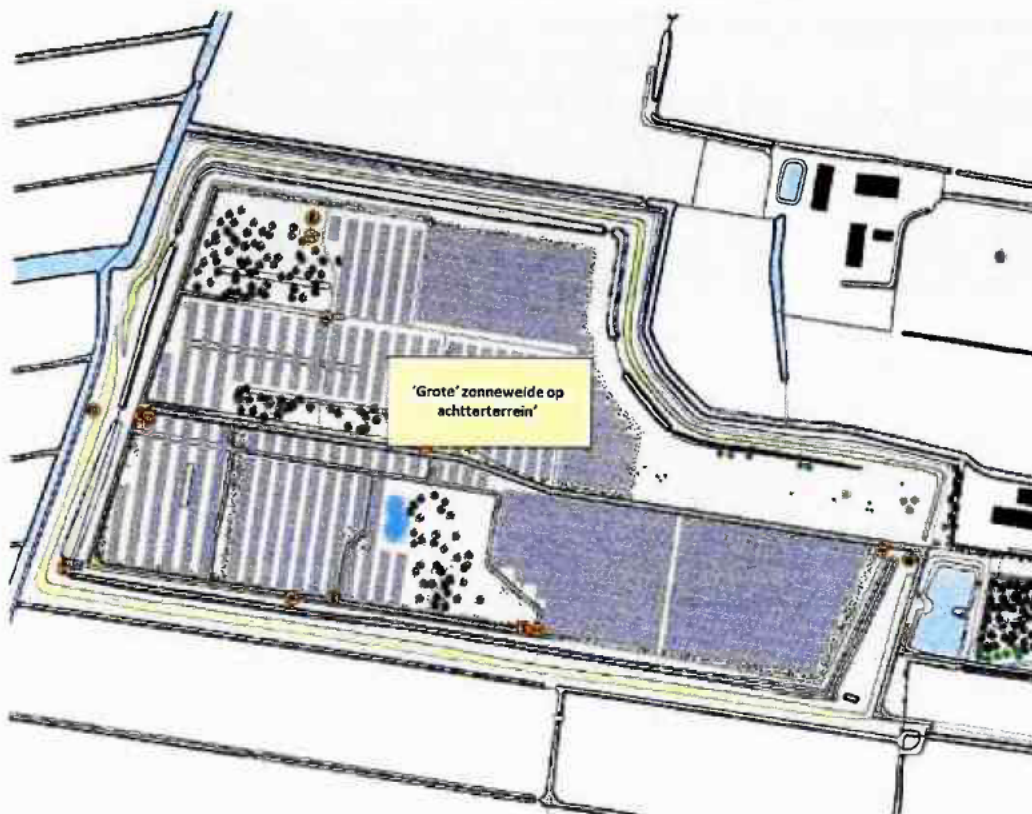
Figuur 3: landschapsimpressie 'grote' zonneweide op het hoge deel van het terrein