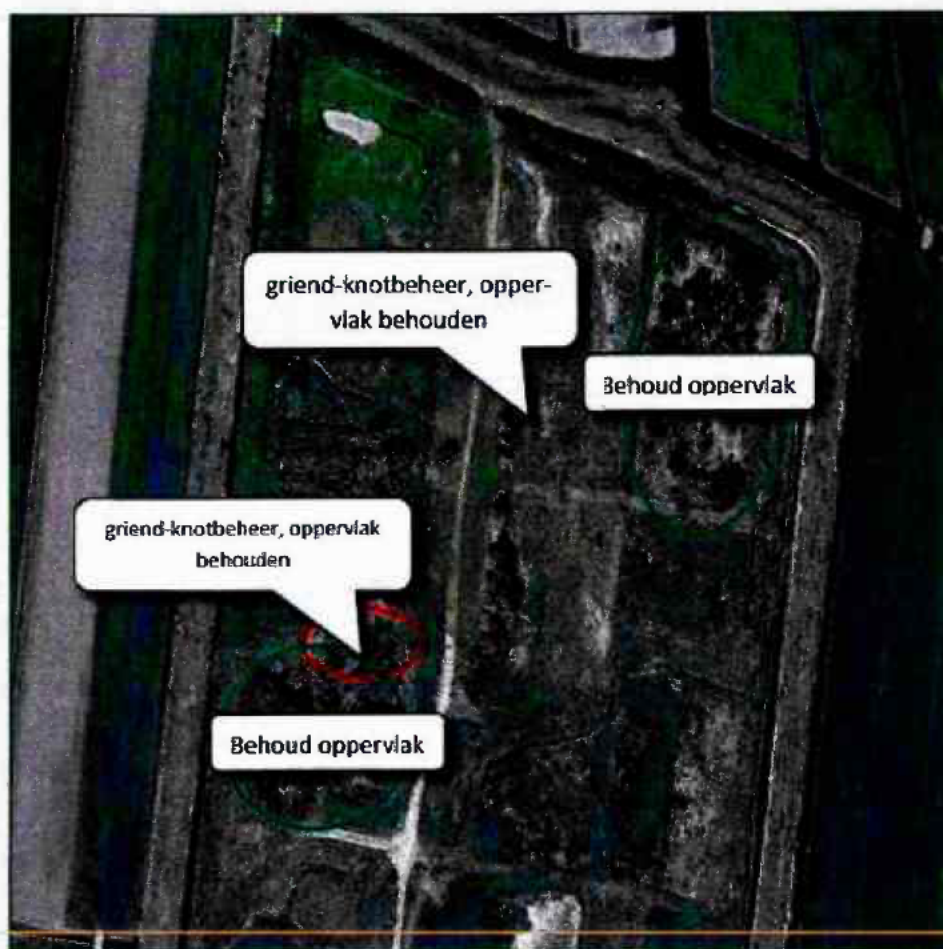
Figuur 4, overzicht te behouden bosjes (bron: "Uw verzoek om aanvullende gegevens zaak Z-WNB-RI-REG-2020-1258" van 18 mei 2021)

De houtige en hogere begroeiing blijft in oppervlak behouden maar een deel van de wilgen/elzen wordt zodanig laag afgezet/geknot dat een soort griend ontstaat waar potentieel landbiotoop voor Heikikker blijft bestaan maar waar de bomen geen belangrijke beschaduwing en bladval veroorzaken op zonnepanelen of de paddenpoel, zie onderstaande figuur.