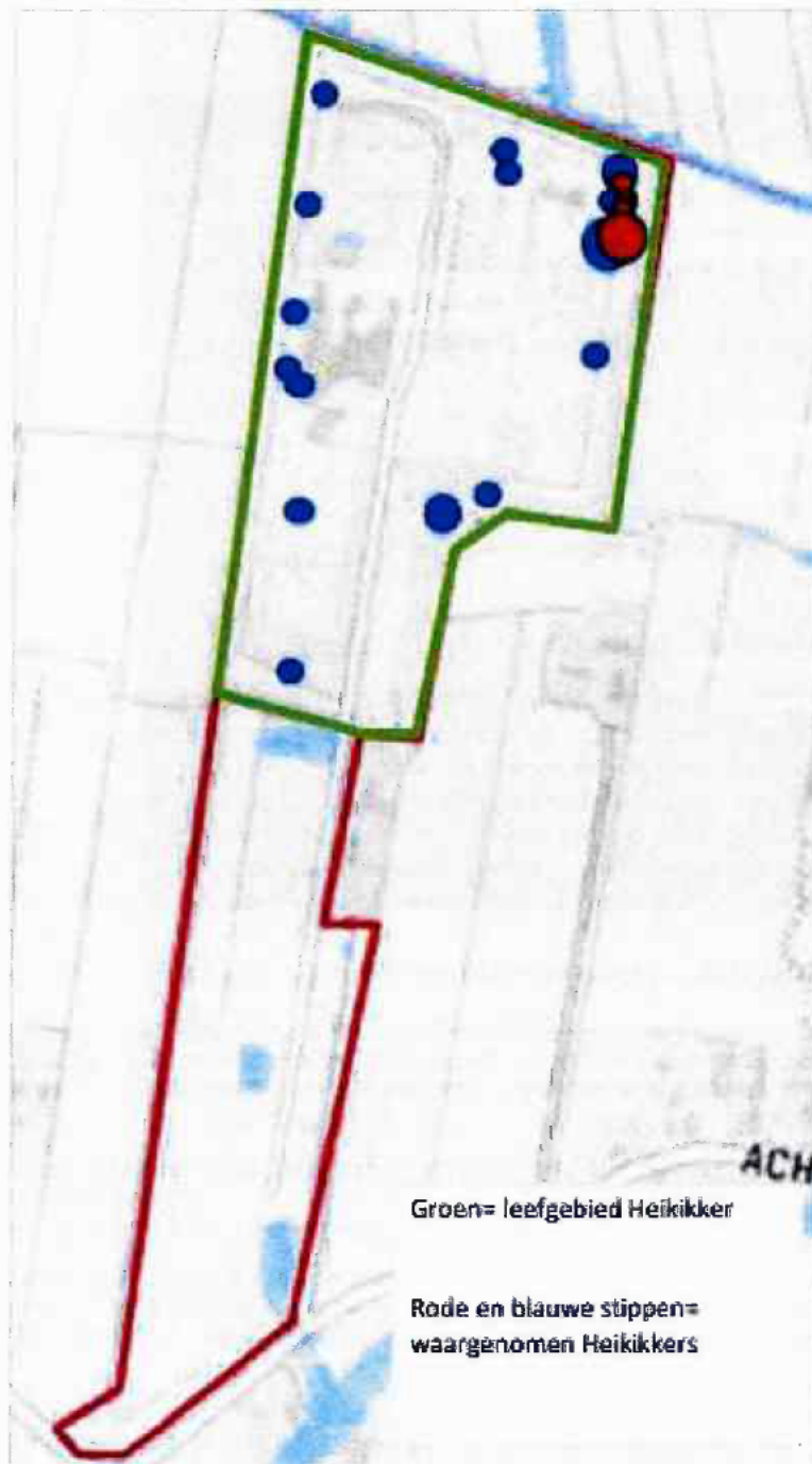
Figuur 5, locaties heikikkers gevonden in maart en april 2020