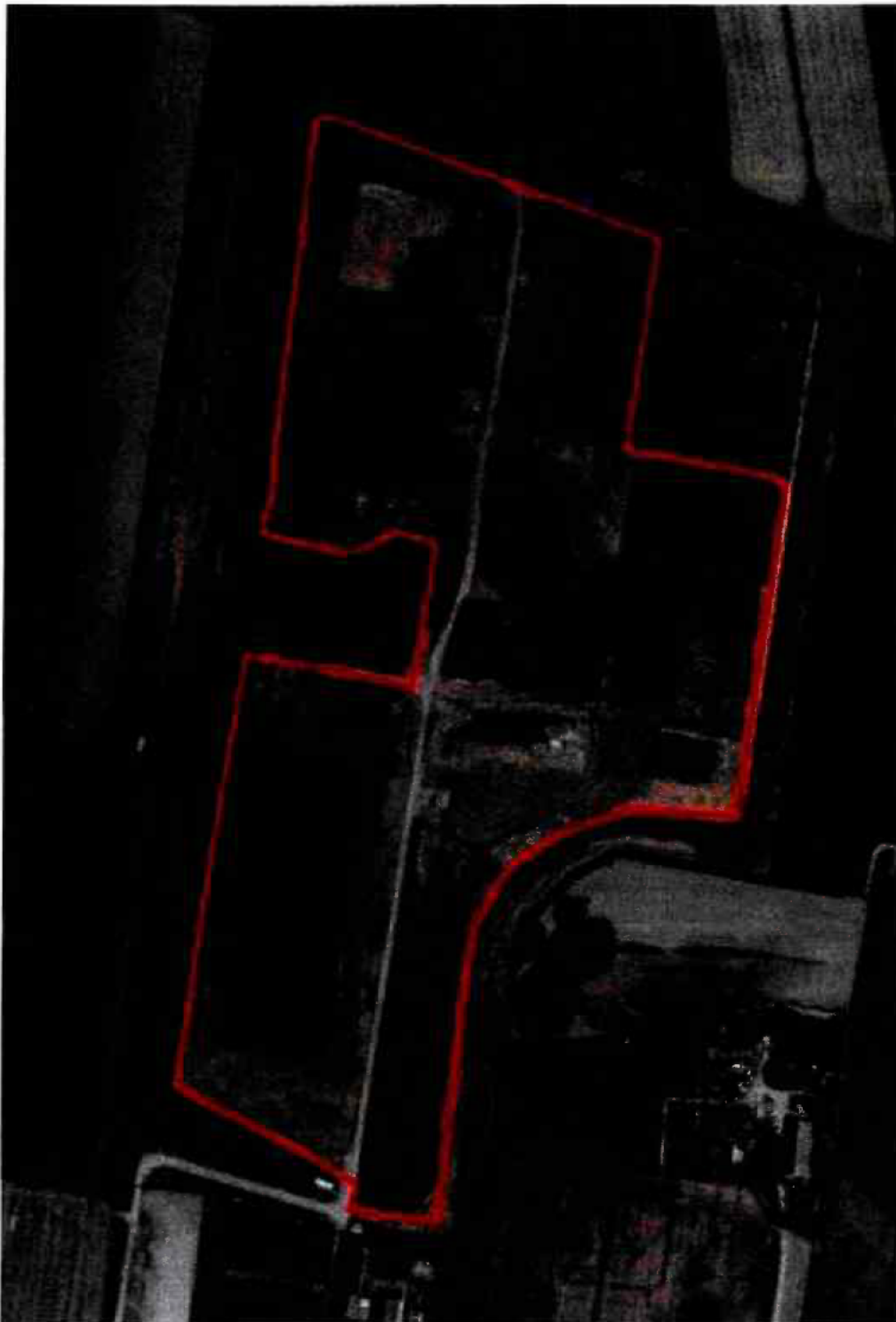
Figuur 6, Plaatsing amfibieënscherm