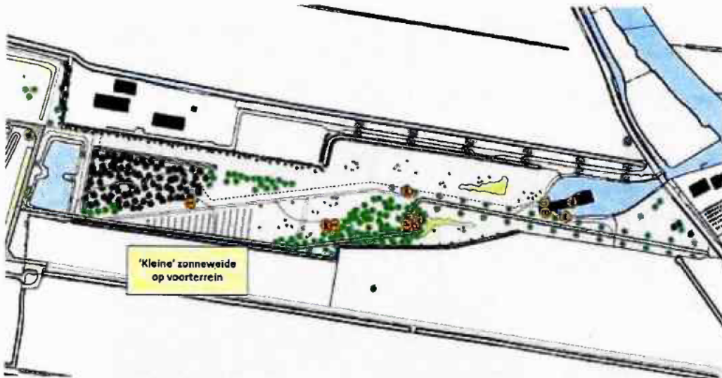
Figuur 2: landschapsimpressie 'kleine' zonneweide in de westelijke driehoek op het voorterrein