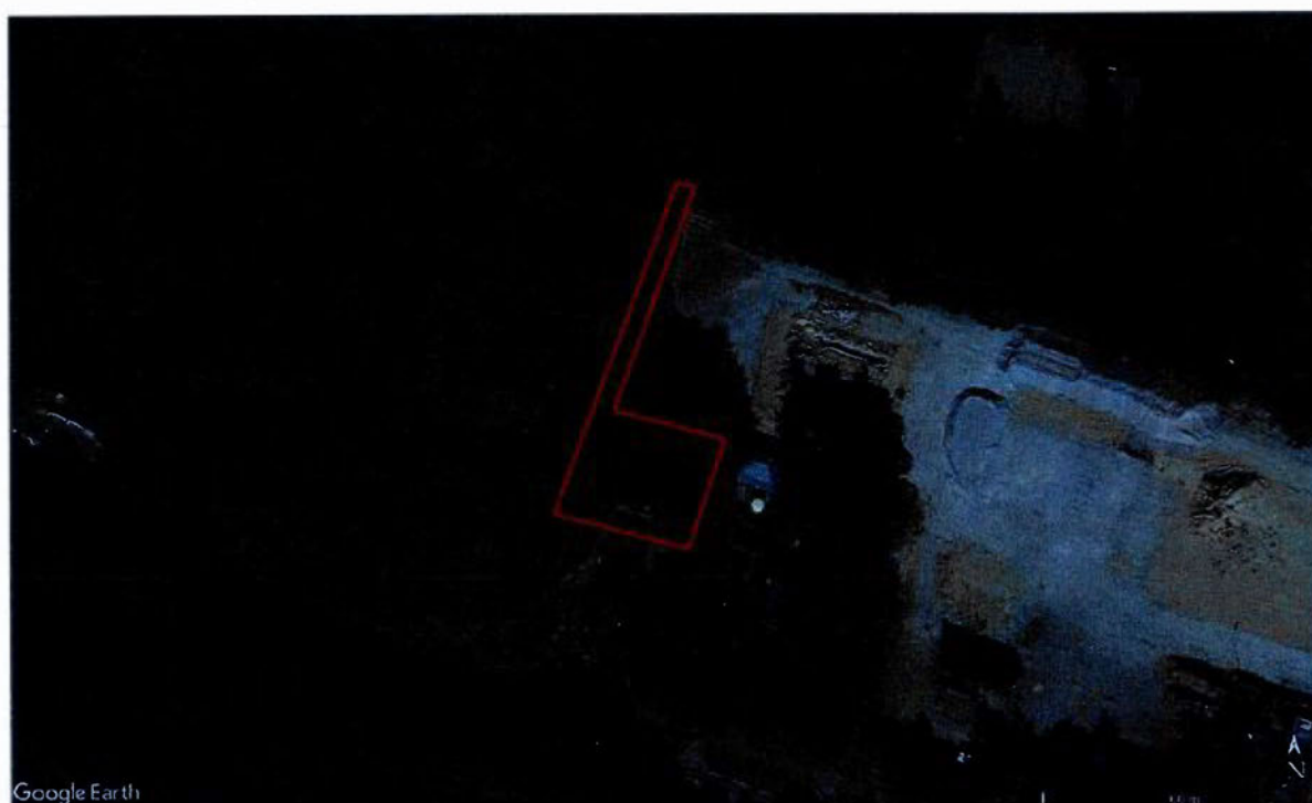
Figuur 2 Leersumsestraatweg 5 te Doorn