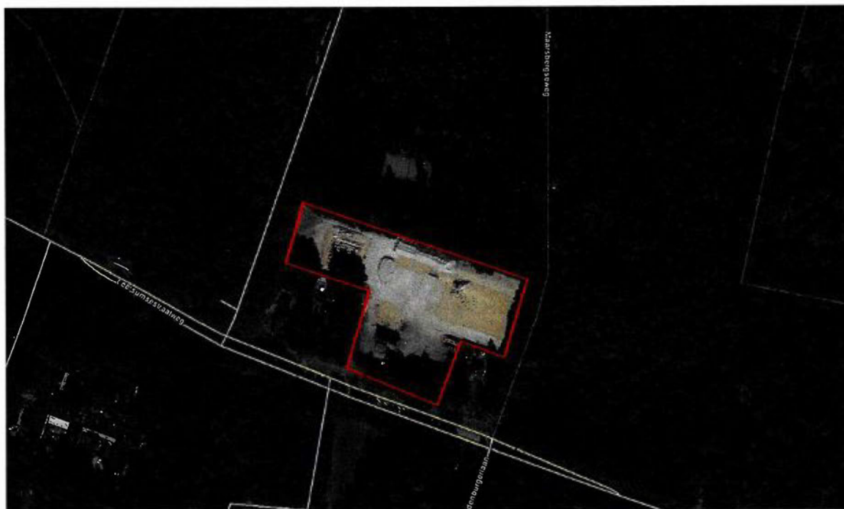
Figuur 1 Leersumsestraatweg 9 te Doorn