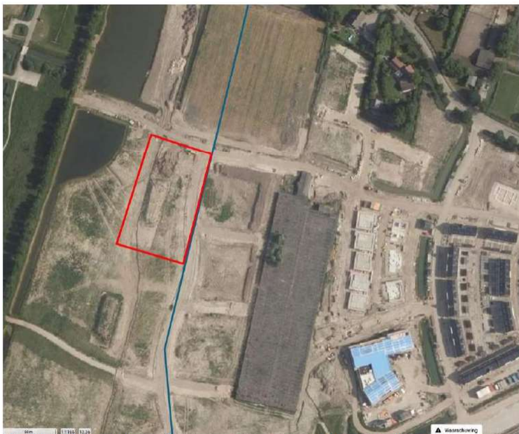
Afbeelding 2: Ligging plangebied (globale grootte) langs de Châteletlaan (blauwe lijn) in 2019.