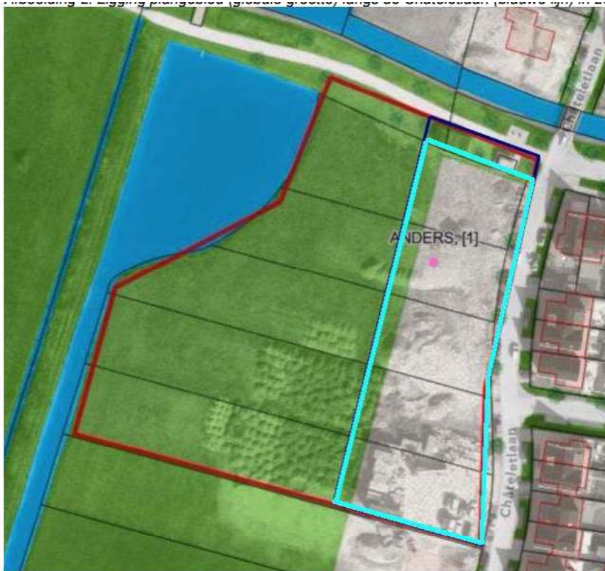
Afbeelding 3: Plangebied blauwe kader. De vijf kavels (belicht) zijn bestemd voor bebouwing. De overige gronden (groen binnen het blauwe kader) worden tijdelijk als bouwweg gebruikt en zijn later bestemd voor agrarisch gebied. ANDERS geeft de locatie van de aangetroffen rugstreeppad aan. Bron: RSK Netherlands.

Bron: Activiteitenplan, Châteletlaan te Vleuten van 19 oktober 2023