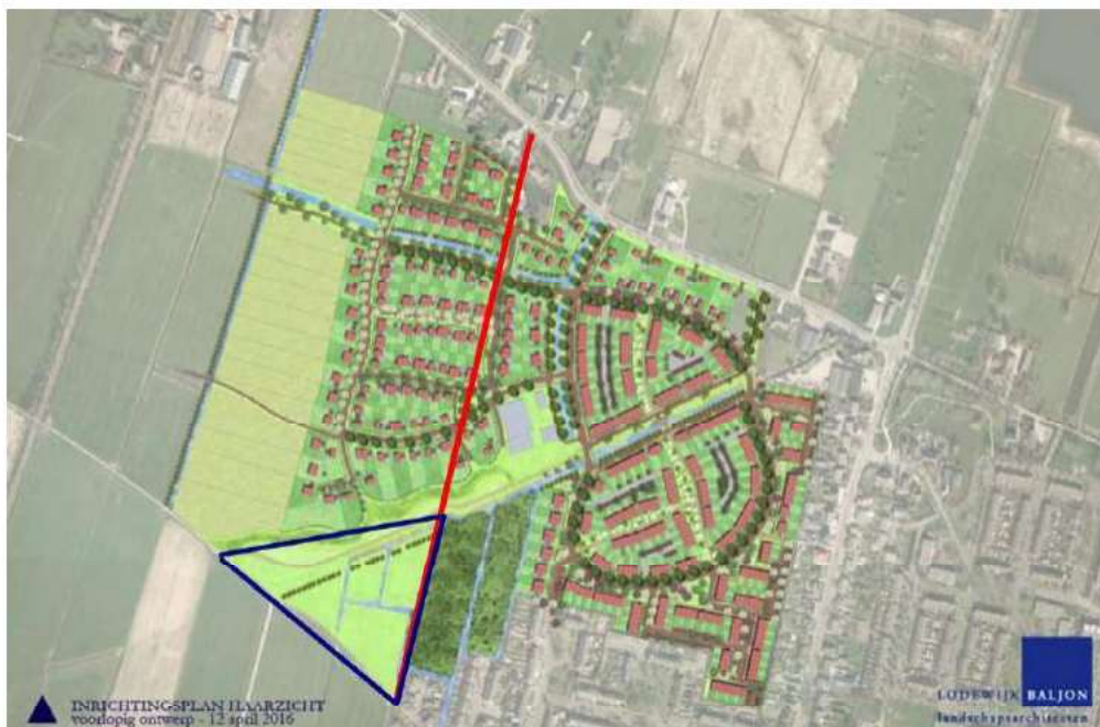
Abbeelding 7: Compensatiegebied rugstreeppad (blauwe driehoek) in het westen van plangebied Haarzicht en nabij de bosjes van Goes.