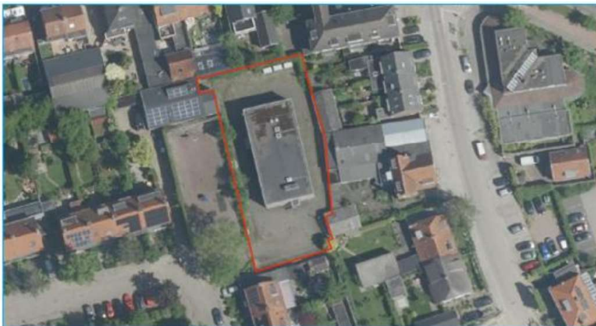
Afbeelding 2: Situering plangebied (bron: PDOK).

Bron: Projectplan Engweg 2a te Bunnik; EcoTierra; 18 september 2023.