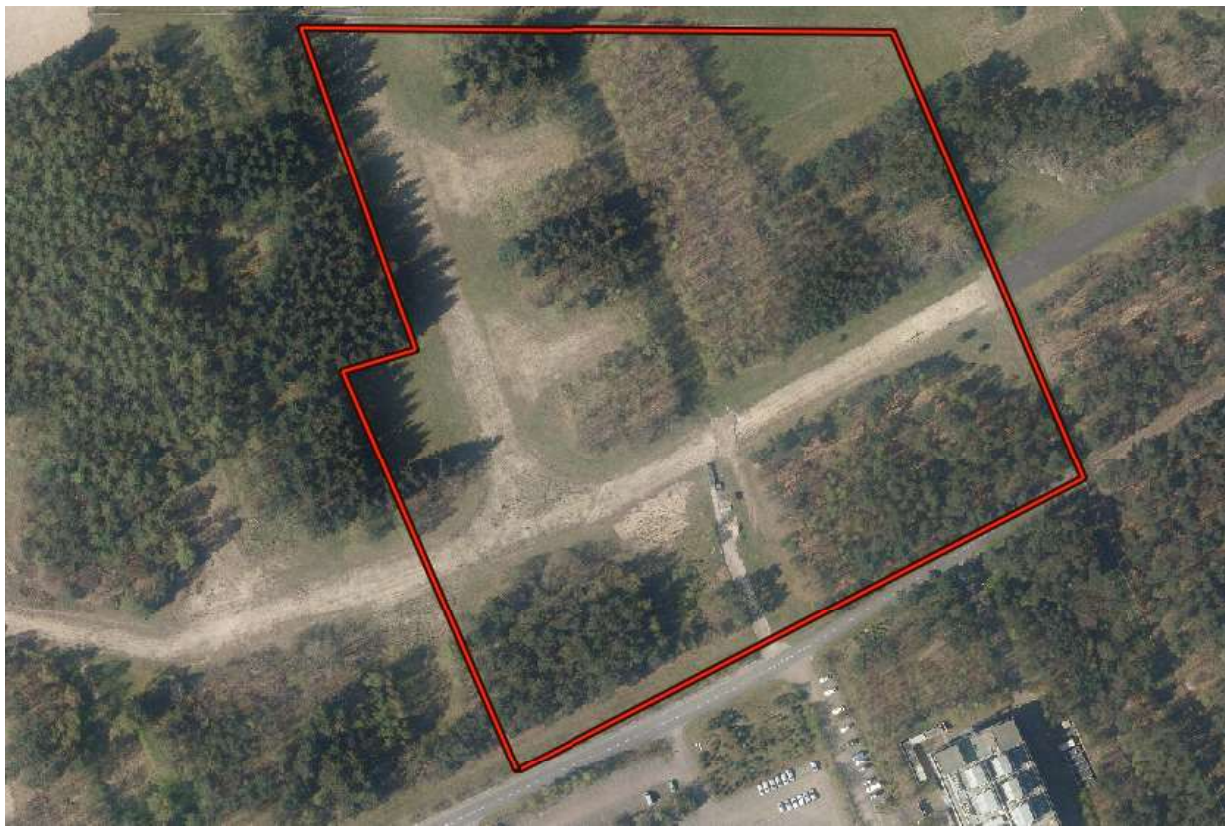
Afbeelding 1: Luchtfoto van de vellingslocatie in 2016

Onderstaand zijn de velling en compensatielocatie weergegeven die behoren bij het besluit van Gedeputeerde Staten van Utrecht van 28 maart 2024, met zaaknummer Z-PU-2024-000513.