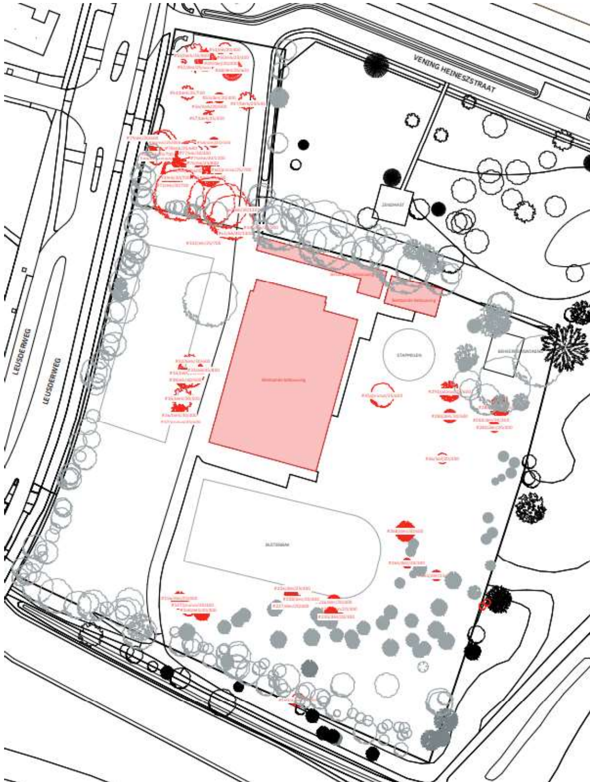
Afbeelding 1: De vellingslocatie met in rood de gevelde bomen.

Onderstaand zijn de velling- en compensatielocatie weergegeven die behorende bij het besluit van Gedeputeerde Staten van Utrecht van 2 mei 2024, met zaaknummer Z-PU-2024-000717.