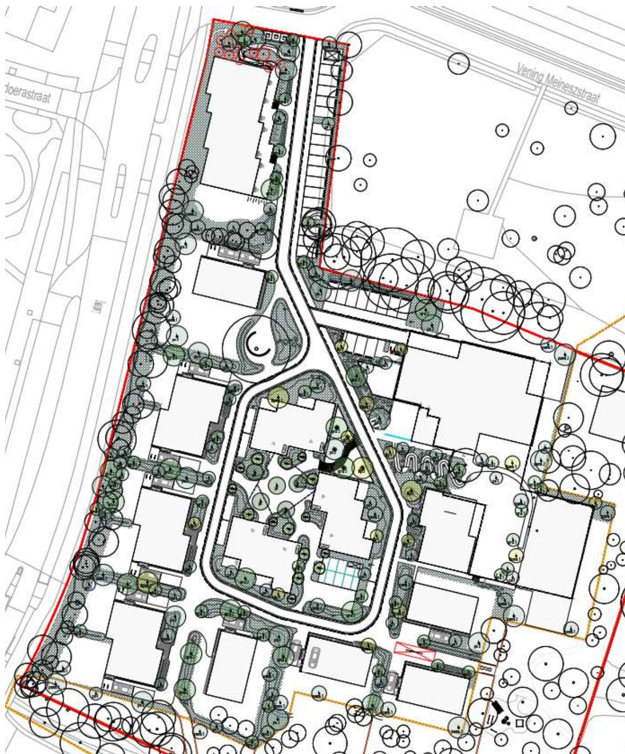
Afbeelding 2: compensatiegebied Common Woods.